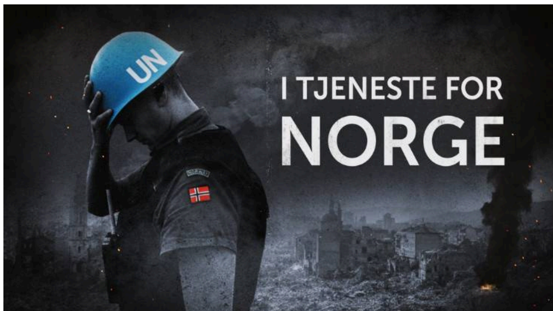
Illustrasjon: NRK. I tjeneste for Norge.

Så er det noen som ikke helt greier å håndtere en del av opplevelsene og som får etterreaksjoner. Disse kan komme flere år i etterkant, og Norges veteranforbund for internasjonale oppdrag (NVIO) kjenner historier hvor det har gått over 30 år siden hendelsene og til en diagnose på at man sliter psykisk. Da er det viktig å ha et nettverk rundt seg, som kan støtte en når dagene er som verst. Det er ikke bare den medisinske utredningen og avgjørelsen som kan være både vanskelig og utmattende, men for å få erstatning for de skader som er påført disse veteranene.