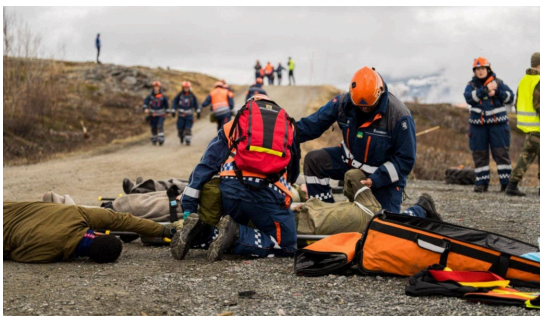
I Øvelse Istind øvde Sivilforsvaret om lag 400 ansatte og tjenestepiktige fra hele landet på en situasjon der Norge er i krig. I tillegg deltar mannskaper fra Sivilforsvaret i Danmark, som har spesial-kompetanse på søk og redning i sammenraste bygninger.