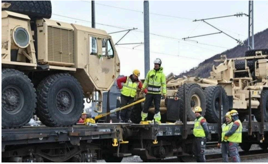
TUNG LAST: Amerikanske militære kjøretøy festes på jernbanevogner i Narvik.