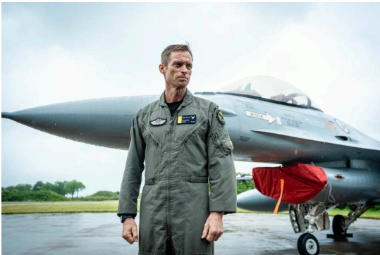
Tidligere luftforsvarssjef Rolf Folland er bekymret.

Uttalelse fra Landsrådet for Heimevernet