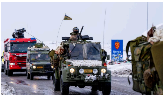
Bildet er fra en samvirkeøvelse i forbindelse med Cold Response 2026, 6. mars 2026.