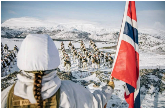
Soldatene fra utdanningskompaniet i Finnmark heimevernsdistrikt 17 har formaningsoppstilling i forbindelse med avsluttende øvelse i rekruttperioden og får utlevert beret.