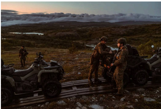
Soldater på garnisonen i Sør-Varanger.