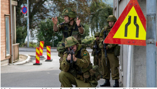
Heimevernssoldater fra Agder heimevernsdistrikt og Rogaland heimevernsdistrikt under øvelse Hafrsfjord.