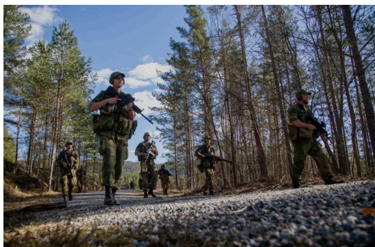
Illustrasjon: Forsvaret. Øvelse Jøssing i Rogaland Heimevernsdistrikt 08.