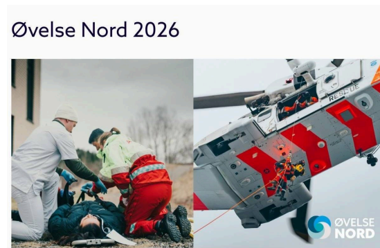
Øvelse Nord 2026.