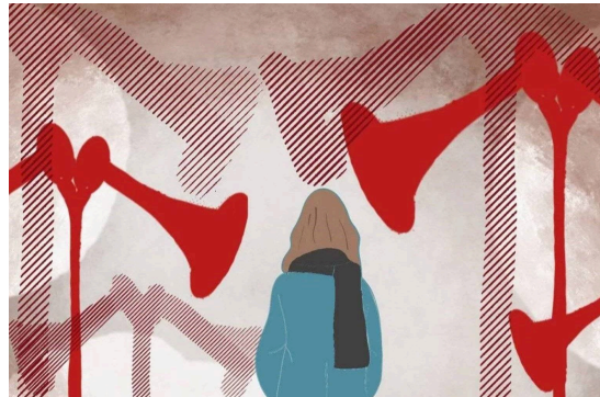
Illustrasjon: Nrk.no. Når alarmer går.