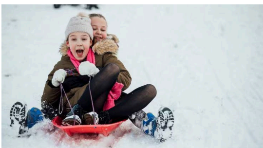
Aking for Norge.