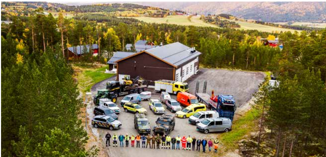
Norsk TotalforsvarsForum er opptatt av sivil-militært samarbeid og et helhetlig og moderne totalforsvarskonsept som består av gjensidig støtte, samarbeid og optimal ressursbruk mellom Forsvaret og det sivile samfunn om både forebygging, beredskapsplanlegging og operative forhold.

gjærne som den «synlige brobygger» innen det sivil-militære samvirket.