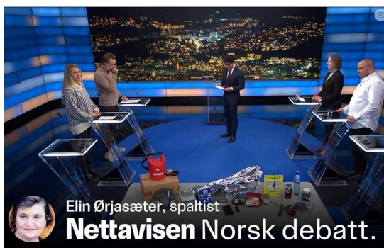
BARE Å BEGYNNE Å HANDLE: «V.M.B», forklarte prepereren, «det står for vann, mat, varme. Vanskeligere er det ikke».