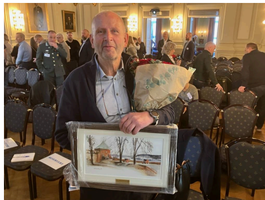
Rådsstrukturen gjør en kjempeinnsats for å øke beredskapen og samarbeidet mellom sivilbefolkningen og HV, fremhever Jørgen Roaldset.