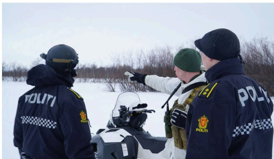
Sampatrujering med Garnisonen i Ser-Varanger og Finnmark Politidistrikt ved Russergrensa i 2021.