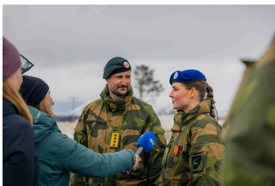
Prinsesse Ingrid Alexandra og kronprins Haakon blir intervjuet av NRK.