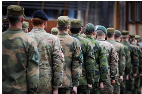
Oppstilling Hæren.