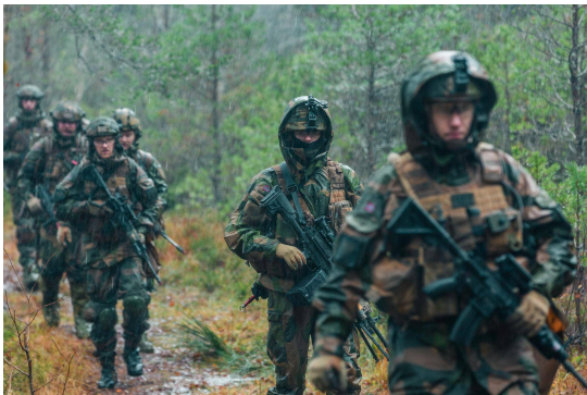
Innsatsstyrke Archery samtrener med Ålesund HV-område.