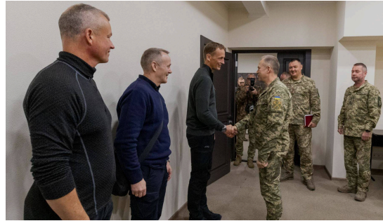
Utenfor Kharkiv, langs fronten i øst, møtte forsvarssjefen Ukrainas forsvarssjef Oleksandr Syrskij.