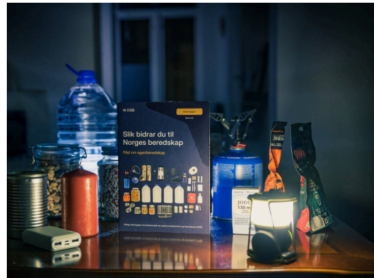
Ny brosjyre 2024 - Egenberedskap.