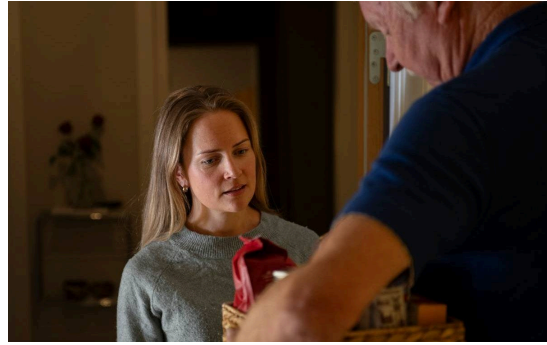
Eldre og enslige er overrepresentert i dødsbrannstatistikken.