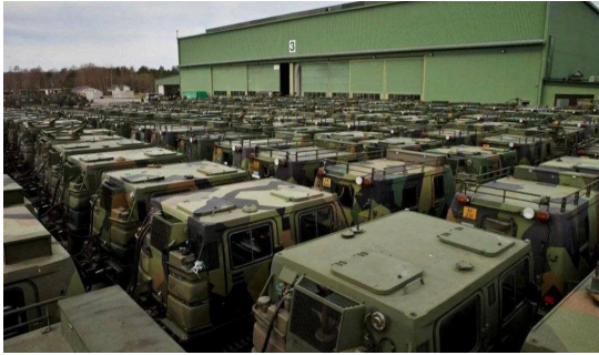
Oppstilt landmateriell i forbindelse med en vedlikeholdsovelse på Værnes Military vehicles.