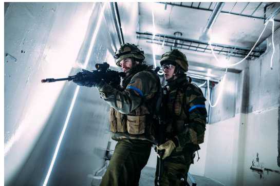
Fra øvelse Jøssing 2023. HV-08 på oppdragsløsning, Odderøya renseanlegg.