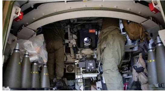
K9 vogner fra Artilleribataljonen i Brigade Nord under øvelse.