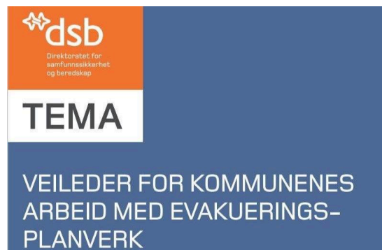
Ny veileder om evakueringsplanverk.