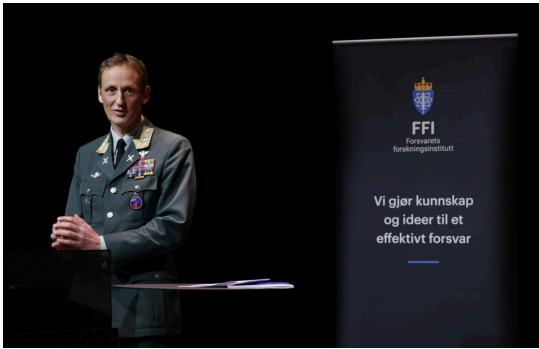
Forsvarssjef general Eirik Kristoffersen i forbindelse med fremleggelsen av Fagmiljøert råd 2024.