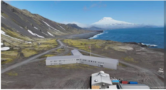
Skjermdump fra Jan Mayen / Forsvarsbygg.