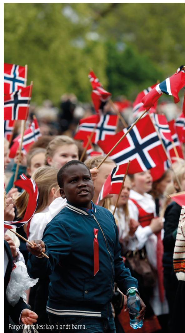
Fargerikt fellesskap blandt barna.