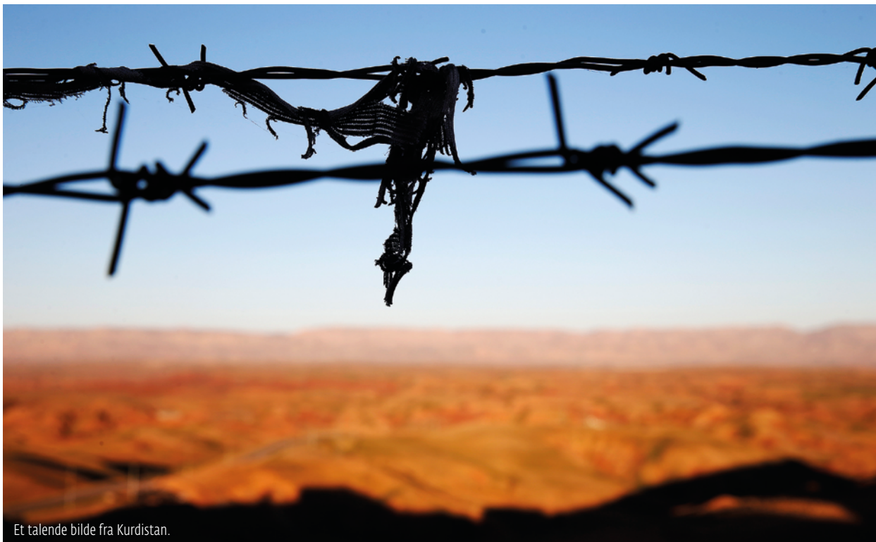
Et talende bilde fra Kurdistan.