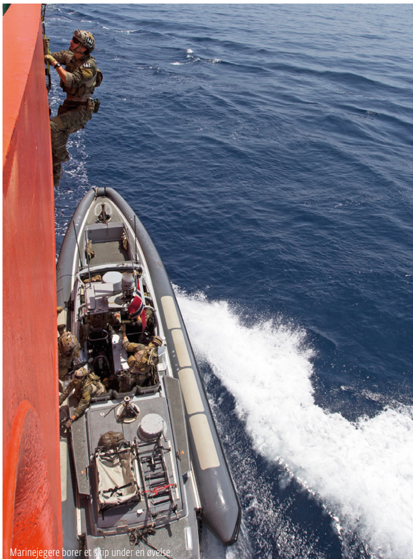
Marinejegere borer et skip under en øvelse.