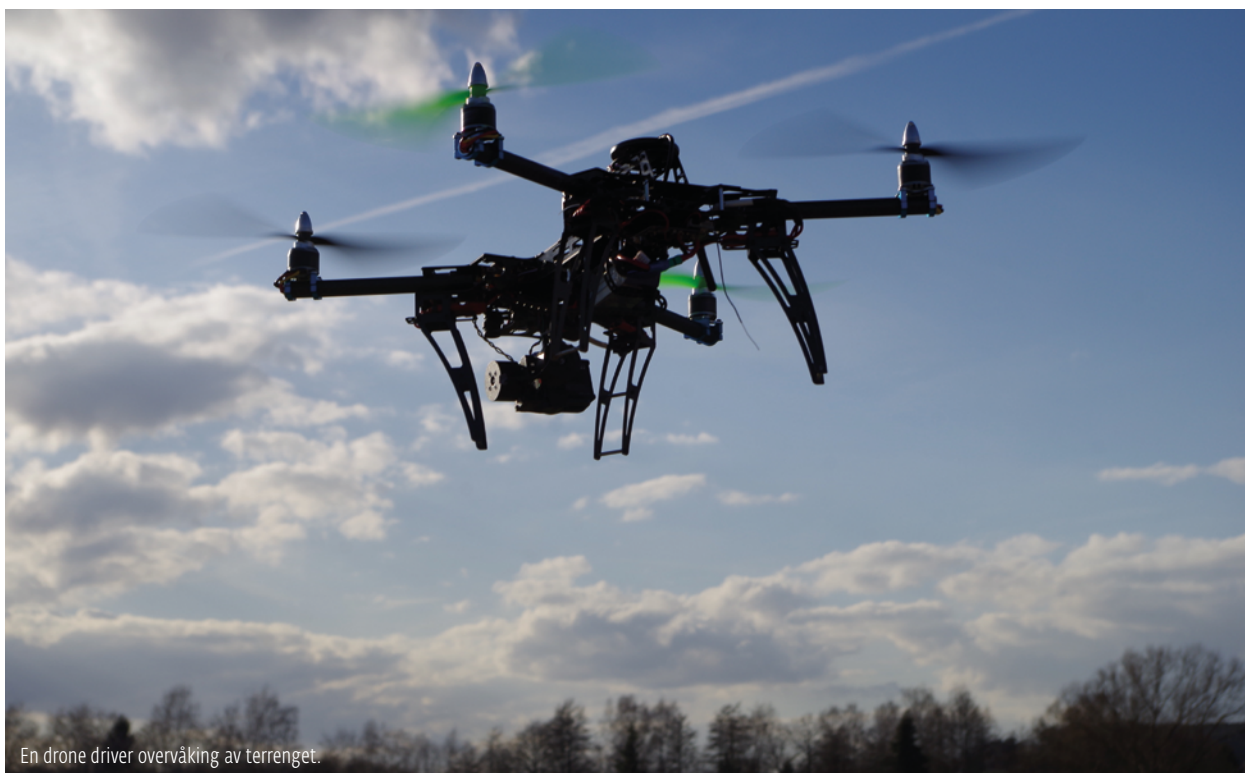
En drone driver overvåking av terrenget.