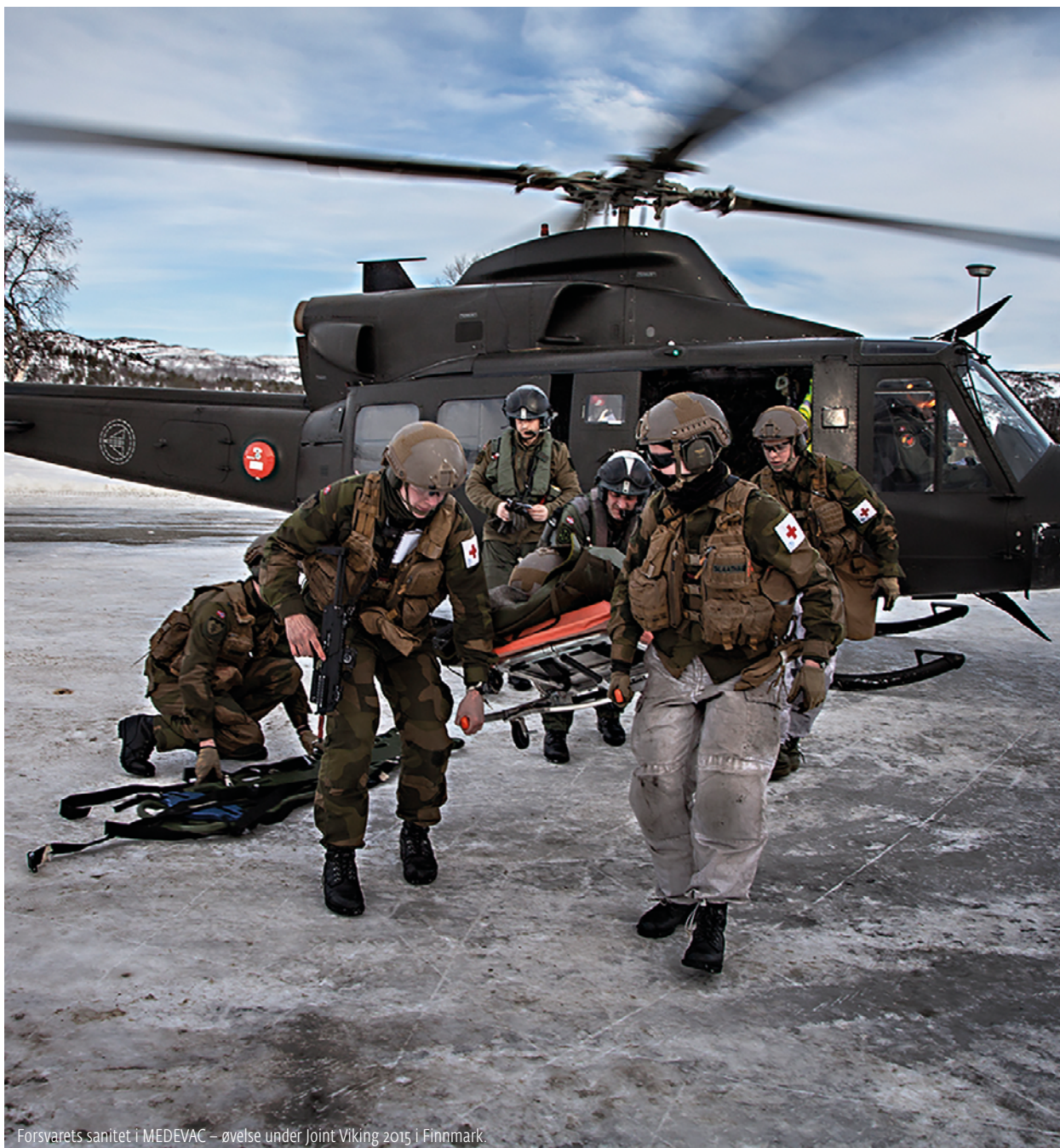
Forsvarets sanitet i MEDEVAC – øvelse under Joint Viking 2015 i Finnmark.