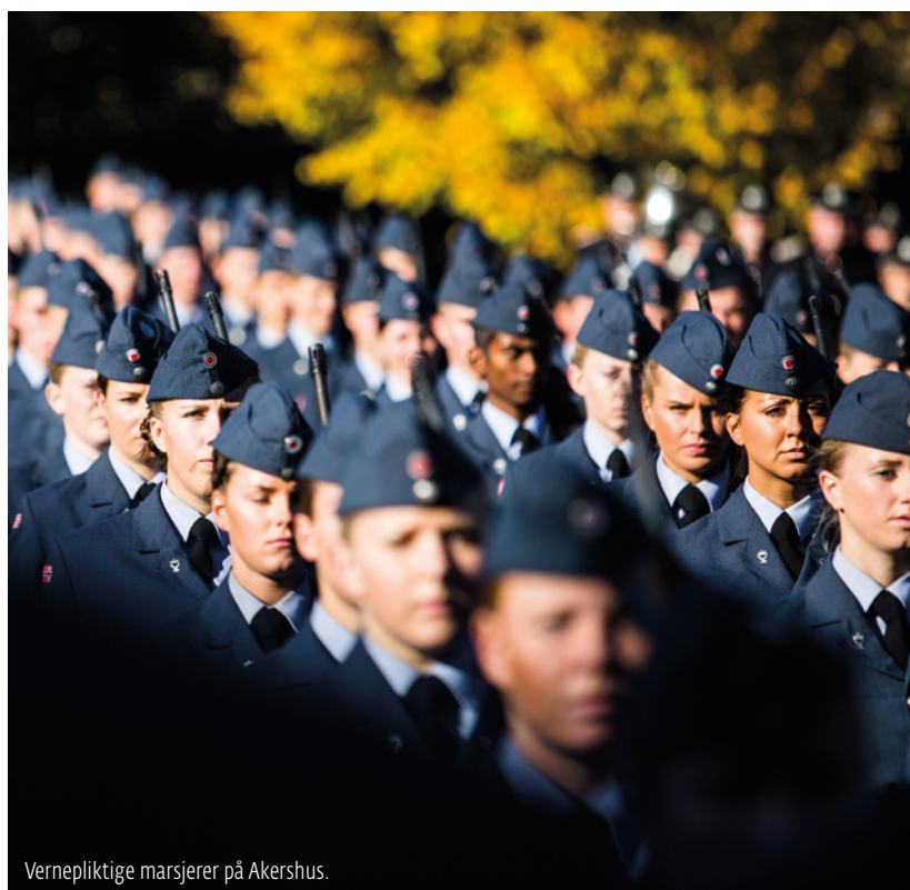
Vernepliktige marsjerer på Akershus.

– Det er ene og alene Forsvarets behov som styrer hvem og hvor mange som tas inn i førstegangstjenesten. Forsvaret er en populær arbeidsplass mange søker seg til. Mange av dem med frem-