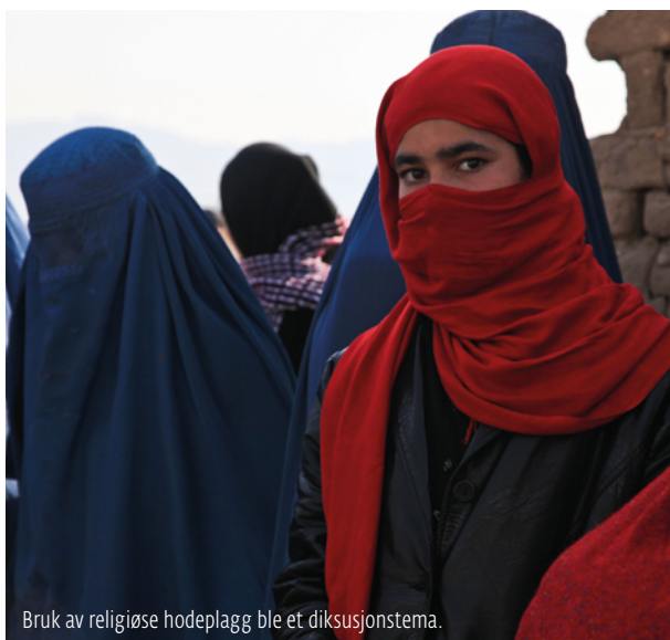
Bruk av religiøse hodeplagg ble et diskusjonstema.

Undersøkelsen kan i sin helhet lastes ned fra www.folkogfosvar.no