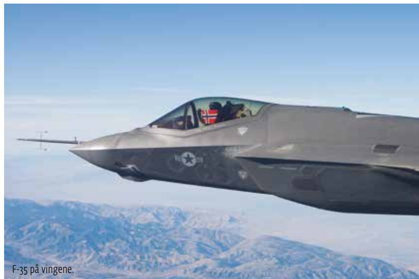
F-35 på vingene.