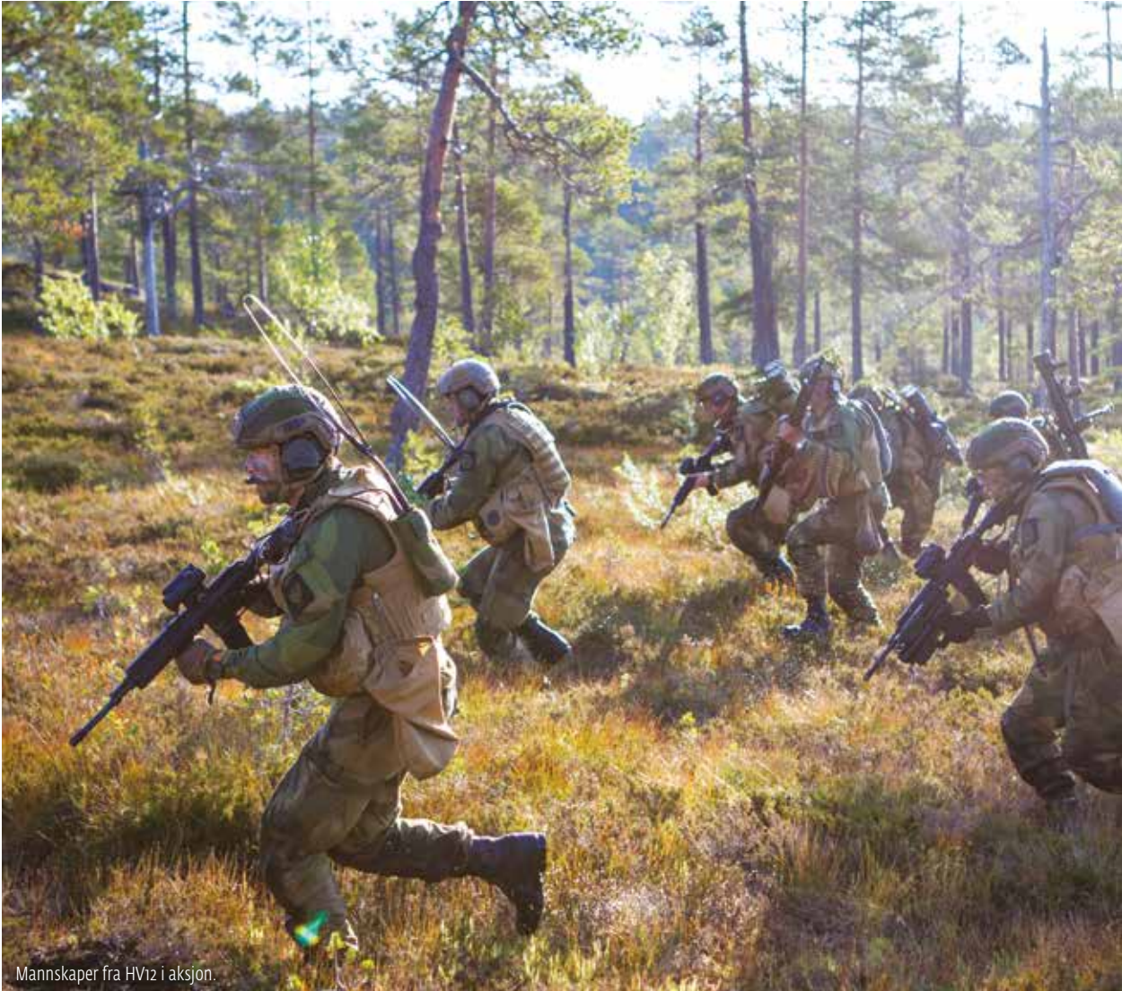
Mannskaper fra HV12 i aksjon.