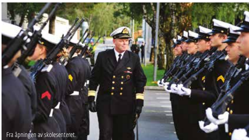
Fra åpningen av skolesenteret.

De nye og ombygde vognene vil dessuten gi økt beskyttelse for mannskapene som opererer dem. Nye kapasiteter vil bl.a. være økt mine- og ballistisk beskyttelse, i form av fjernstyrt våpenstasjon og gummibelter for økt fremkommelighet. Dette gir en betydelig bedre beskyttelse for personellet mot veibomber og miner. Samtidig gir det økt kapasitet når det gjelder observasjon og siktemidler, slik at en er i stand til å bekjempe en motstander raskere.