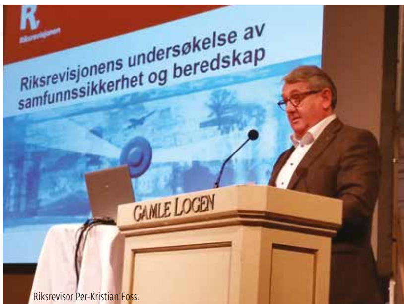
Riksrevisor Per-Kristian Foss.