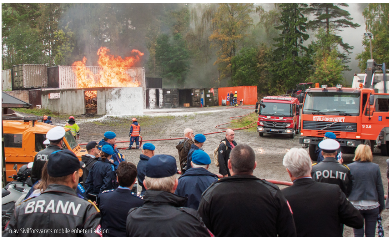
En av Sivilforsvarets mobile enheter i aksjon.

– Dersom en alvorlig situasjon inntreffer er det sivile samfunn og Forsvaret gjensidig avhengige av hverandre. Totalforsvaret handler om å ta i bruk alle de virkemidler vi har på