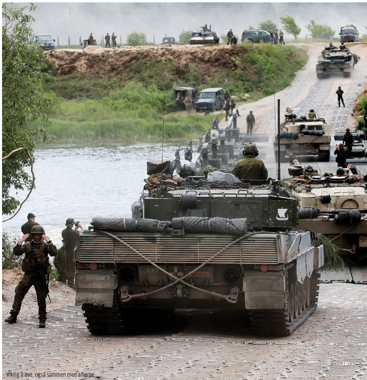
Viktig å øve, også sammen med allierte.