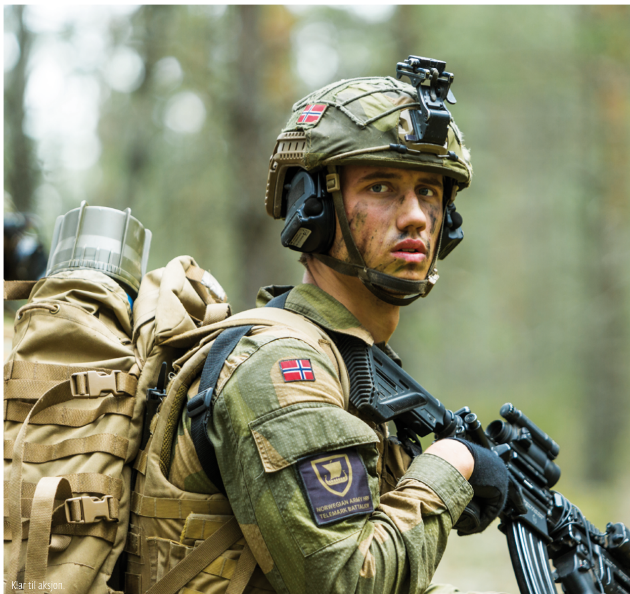
Klar til aksjon.