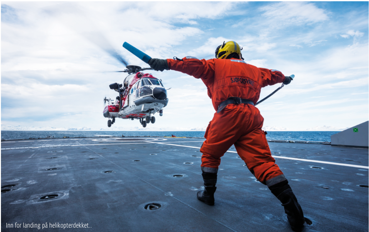
Inn for landing på helikopterdekket..