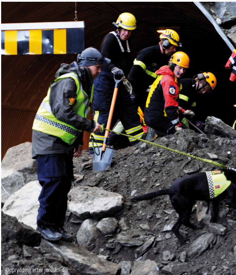
Opprydding etter jordskred.