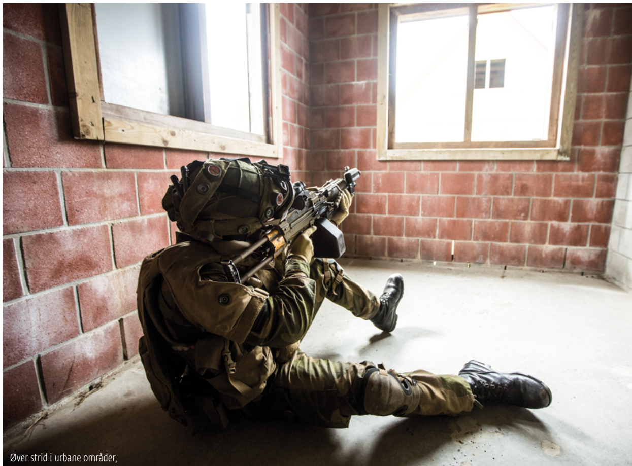
Øver strid i urbane områder,

Samlet sett er det rundt 400 norske soldater som deltar på øvelsen. Flesteparten er fra Telemark bataljon, men også Panserbataljonen, Artilleribataljonen og Ingeniørbataljonen deltar. I tillegg hjelper mannskap fra Hærens Våpenskole, Hærens Befalsskole og den nederlandske Hæren til med å kvalitetssikre treningen.