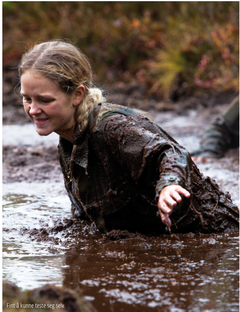
Fint å kunne teste seg selv.