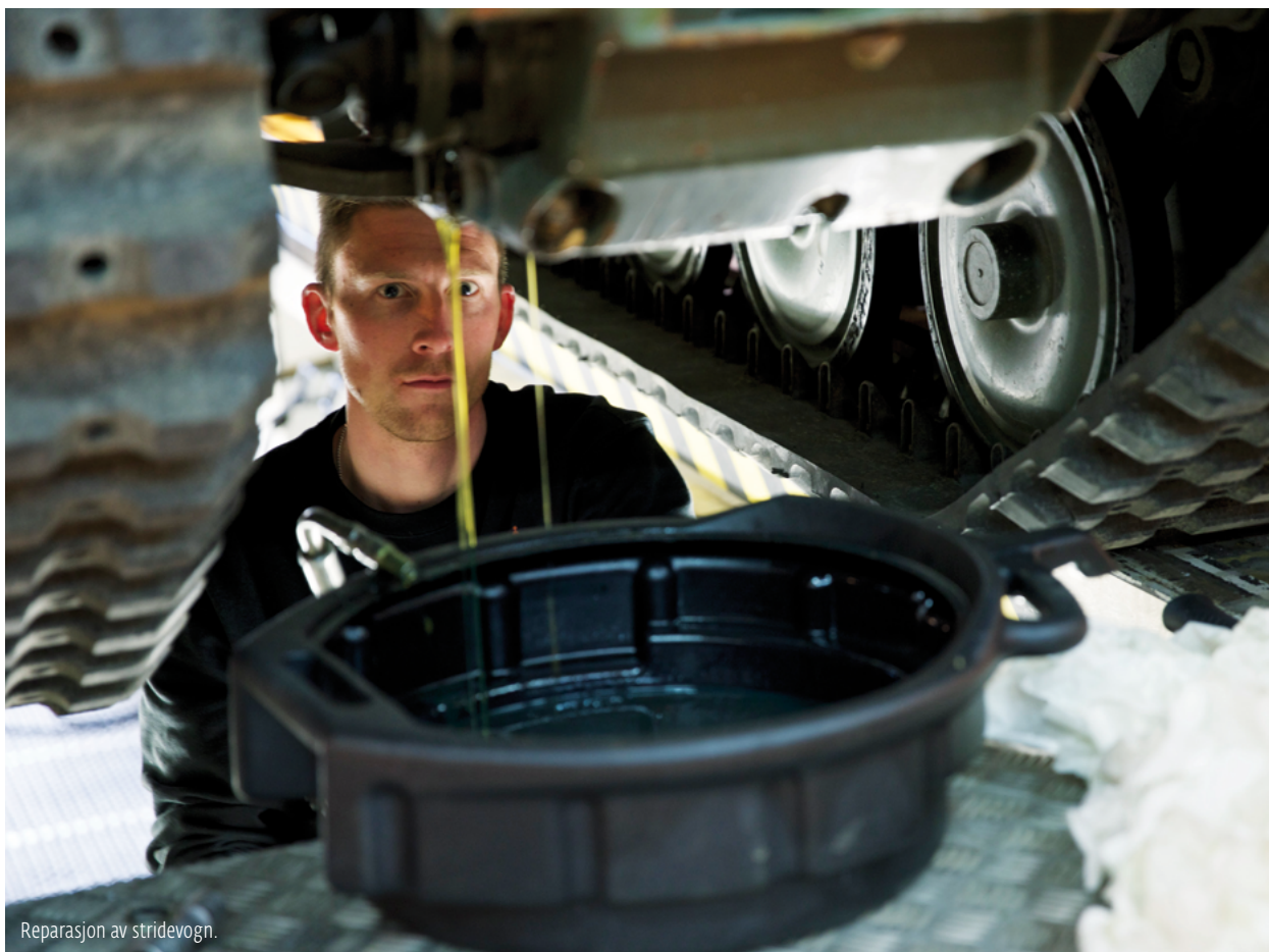
Reparasjon av stridvogn.