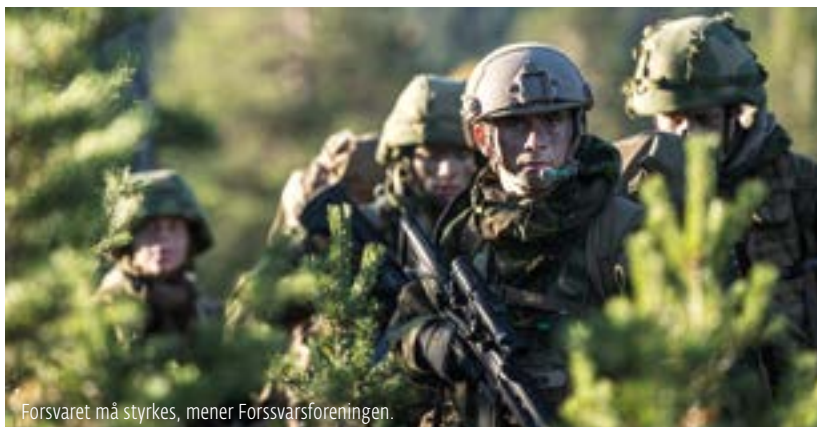
Forsvaret må styrkes, mener Forsvarsforeningen.

Norges Forsvarsforening er en av dem som har engasjert seg sterkt i den nye langtidsplanen for Forsvaret. Gjennom målrettede møter og foredrag rundt om i landet har foreningen slått til lyd for en sterk opptrapping av økonomiske midler til Forsvaret, både på kort og lang sikt. Etter at langtidsplanen ble lansert har Forsvarsforeningen videreført sin kampanje, «Nei til avvæpning av Norge», ved å utgi en ekstra utgave av sitt eget tidsskrift under tittelen «Ekstra: Den nye langtidsplanen for Forsvaret». Der tilkjenner foreningen sine krav og synspunkter på en oversiktlig og leservennlig måte. Det pekes på at Forsvaret i en årrekke har vært underdimensjonert og underfinansiert. Foreningen mener at det nå kreves et politisk forlik slik at en kan være trygge på at Stortinget og kommende regjeringer vil sikre en