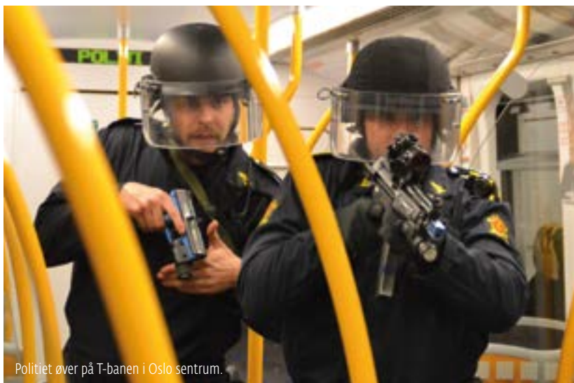
Politiet øver på T-banen i Oslo sentrum.