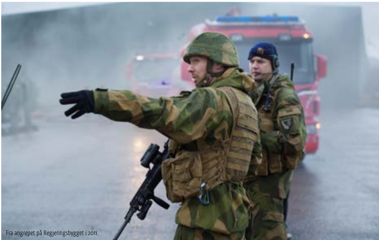
Fra angrepet på Regjeringsbygget i 2011.