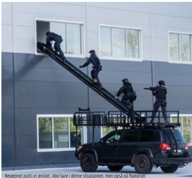
Bevæpnet politi er ønsket, ikke bare i denne situasjonen, men også på flyplasser.