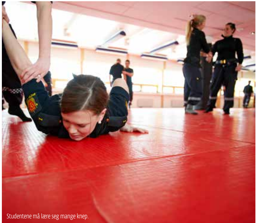
Studentene må lære seg mange knep.