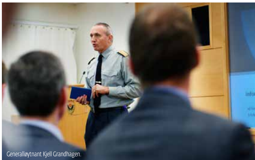
Generalløytnant Kjell Grandhagen.

Det er igangsatt en rekke tiltak etter terroranslagene 22. juli 2011 for blant annet å følge opp anbefalinger fra Gjørø-kommisjonens rapport. En del av disse tiltakene er utviklingsarbeid som nødvendigvis må ta noe tid, men justis- og beredskapsministeren understreker at arbeidet er høyt prioritert. Det er utarbeidet en oppfølgingsplan som senere skal overseendes HOD. Tilsynet avsluttes først når HOD vurderer at JD har fulgt opp forbedringspunktene.