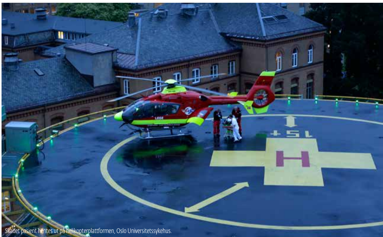
Skadet pasient hentes ut på helikopterplattformen, Oslo Universitetssykehus.