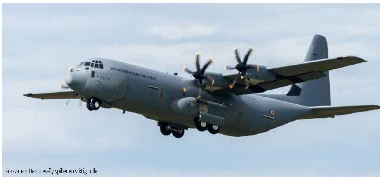
Forsvarets Hercules-fly spiller en viktig rolle.

Overflytting av pasienter kan skje i de såkalte intensivambulanser. Dette er store biler, ofte med plass til to båre. De er utstyrt med mobile intensivenheter og brukes primært til overflytting av pasienter som krever mye utstyr. Disse bilene er dimensjonert og utstyrt for å kunne kjøre rett inn på et av Forsvarets Herculesfly, som så kan frakte hele bilen til bestemmelsesstedet. Eksempelvis benyttes dette dersom det er nødvendig å overføre en pasient fra Østlandet til brannskadeavsnittet på Haukeland i Bergen. Intensivambulansene kan, etter behov, være bemannet med intensivsykepleier, anestesileger og ambulansarbeidere.