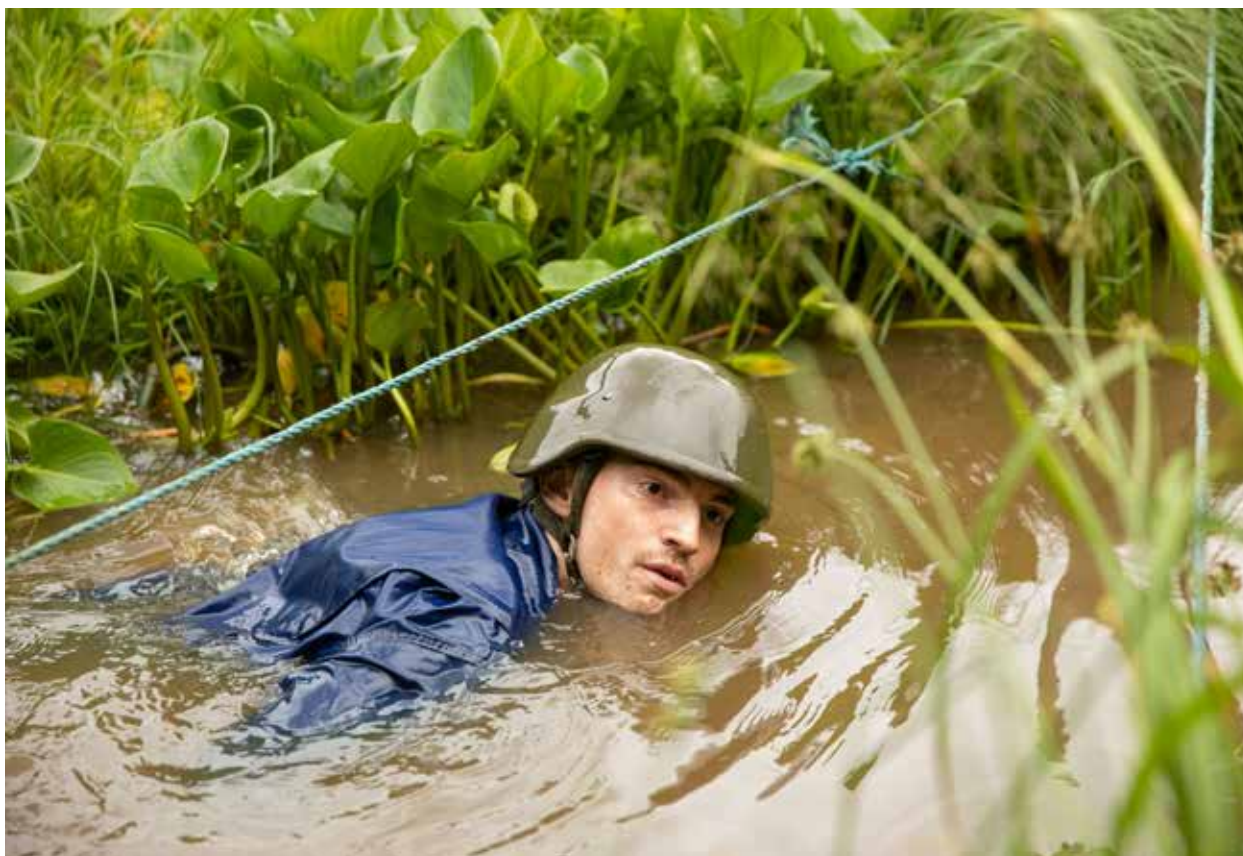
Beredskap er utfordrende.

Det er tilsynelatende vanskelig å erkjenne at også Norge kan bli rammet av en stor krise. Historien gjentar seg; debatten om beredskap kommer alltid opp når noe har skjedd og vi står midt oppe i situasjoner og problemer som vanskelig lar seg løse. Resten av året får verken matforsyning, medisinmangel, politiresurser eller beredskapslagre den samme oppmerksomhet. Eller, som VG skrev i en lederartikkel i sommer: «Føre-var prinsippet synes å ha samme status på politiske beslutningsnivåer som vedlikehold av eksisterende infrastruktur og ivaretagelse av offentlige bygg».