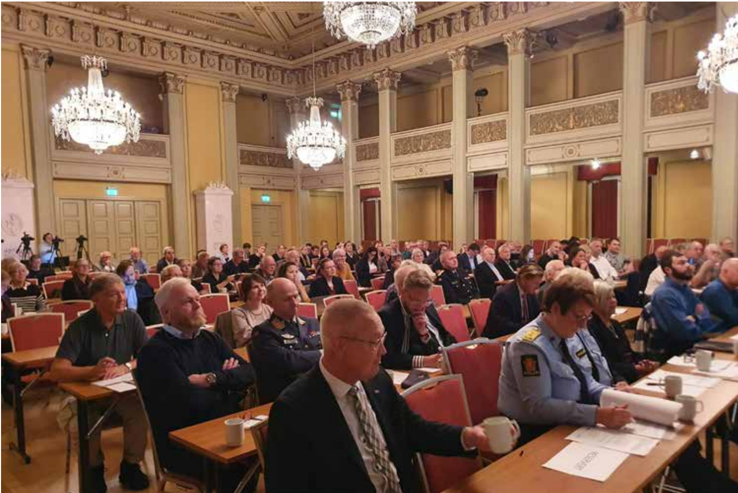
Et utsnitt av deltakerene på konferansen.

Tar de to kommisjonene som nå er nedsatt for å se på Forsvaret og totalberedskapen inn over seg de store endringene når det gjelder bruken av hybride virkemidler i krigføringen? Det er et spørsmål flere stiller seg etter «Sårbarhetskonferansen» 2022.