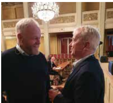
Kommisjonslederene i passiar.

organiserer sikkerhetsarbeidet enn hva det betyr i seg selv, det vil si hvordan vi skal møte denne type utfordringer.