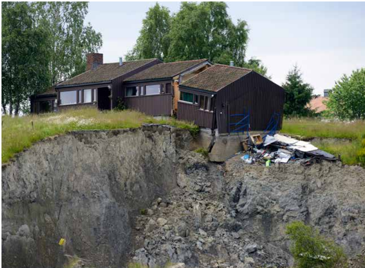
Et eksempel på leirskred.