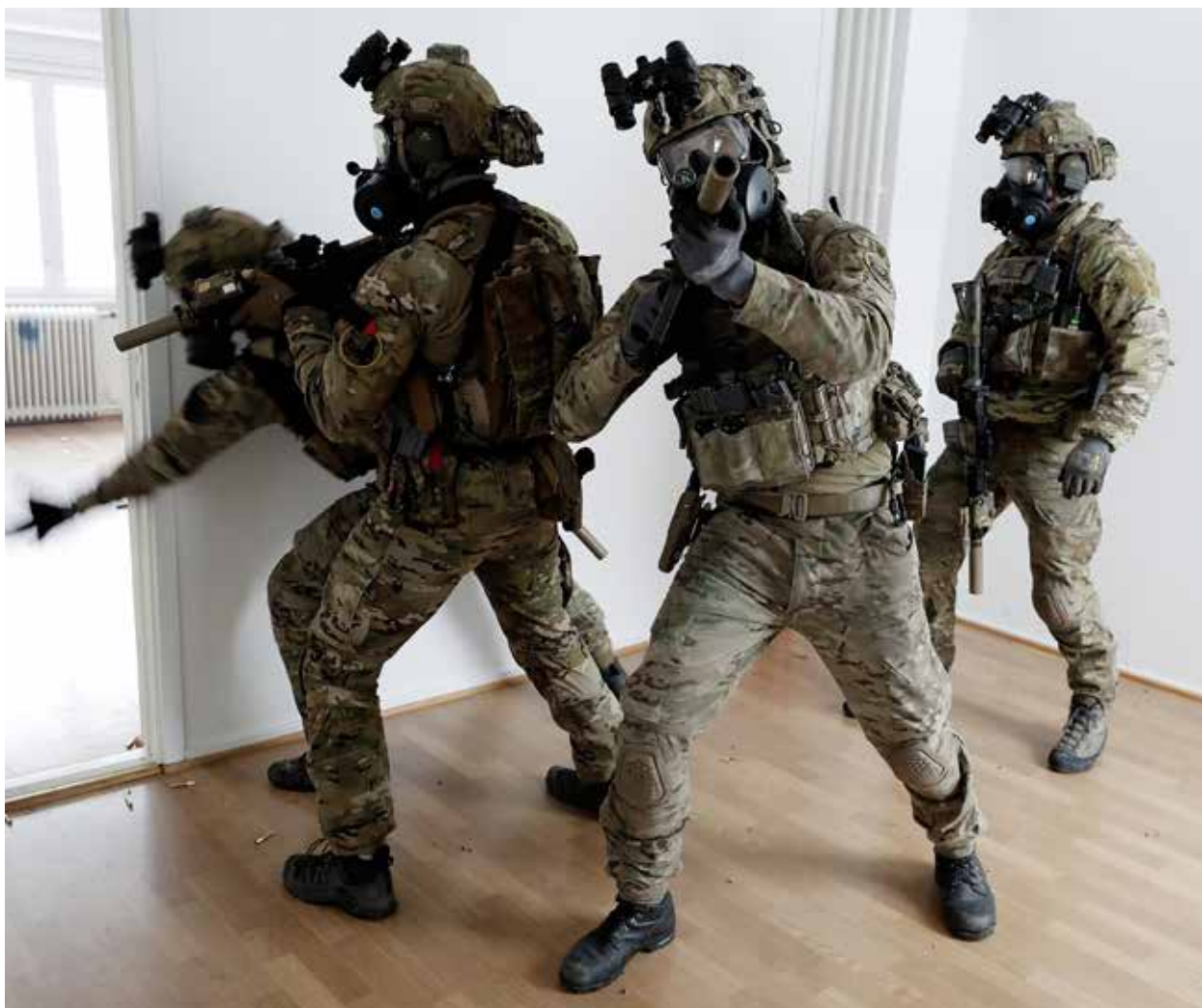
Det er nødvendig å øve mye og jevnlig.

Nordland og Møre og Romsdal. Forsvaret kjøper varer og tjenester lokalt, noe som bidrar til å styrke sysselsettingen. Den direkte økonomiske effekten er estimert til 43 milliarder kroner for 2020, framgår det i rapporten. Økningen fra 2020 til 2021 er på rundt 3 milliarder kroner, som skyldes økning i forbruk og skattebetalinger, vare- og tjenestekjøp og en indirekte effekt av industrisamarbeid.