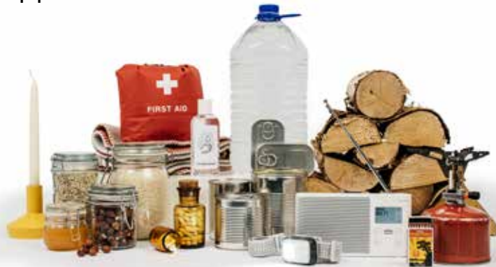
Et eksempel på et beredskap.

Uke etter uke har TV-bildene vist det norske folk hva krig er. I trygge Norge tenker vi som så at det ikke vil skje her. Men krigen har vist oss at vi må ta egenberedskap på alvor.