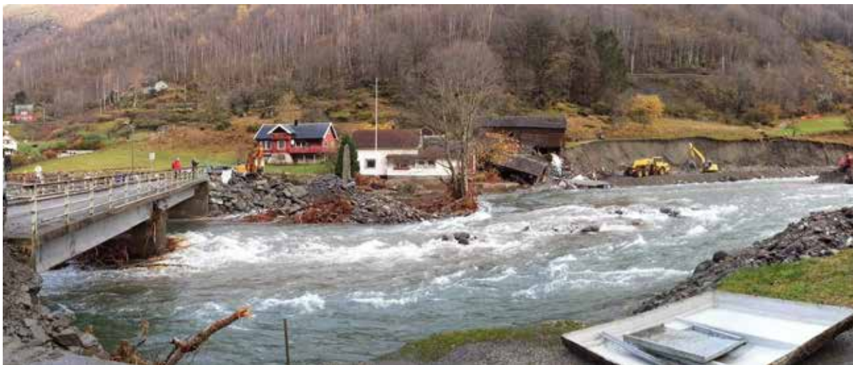
Resultat av en flom.