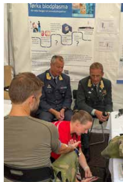
Fra Arendalsuka.

- Det nyetablerte Norsk Koordinerings-senter for Blodberedskap (NokBlod) skal fungere som en samarbeidsplattform. Senteret har en koordine-