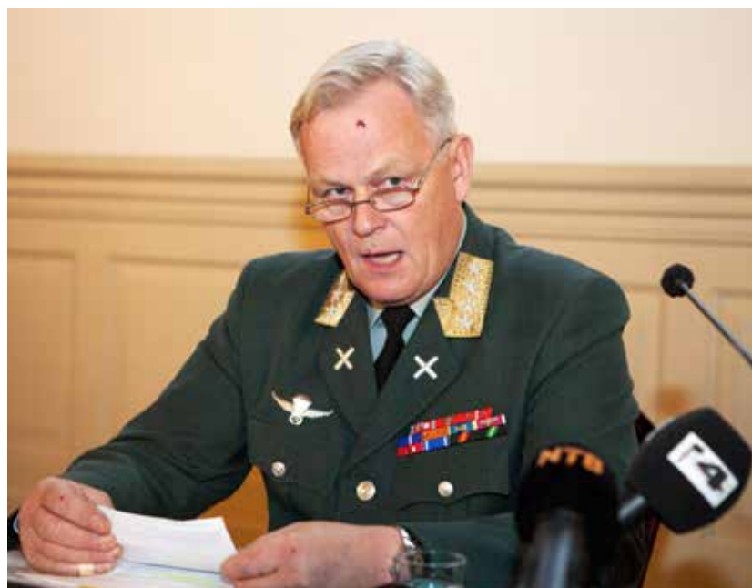
Tidligere forsvarssjef Harald Sunde, leder av Totalberedskapskommisjonen.

En rekke aktører har ansvar innenfor samfunnsikkerhetsfeltet. De operative