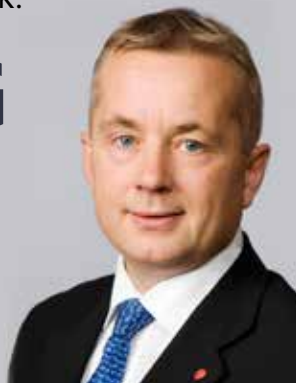
Statsforvalter Knut Storberget, leder av Forsvarskommisjonen.

Forsvarskommisjonen skal se på statens og samfunnets samlede motstandskraft. Det innebærer blant annet å fokusere på samspillet mellom Forsvaret og det sivile samfunn gjennom hele krise- og konfliktspekteret. Forsvarsdepartementet har bedt kommisjonen vurdere syv hovedområder.