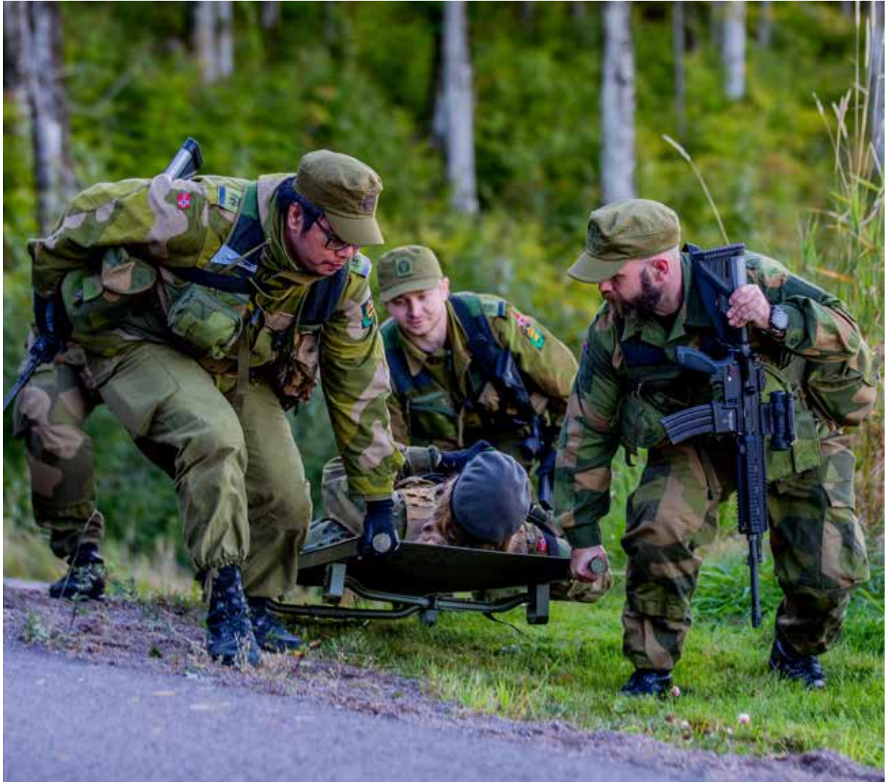
Tunge løft må til.