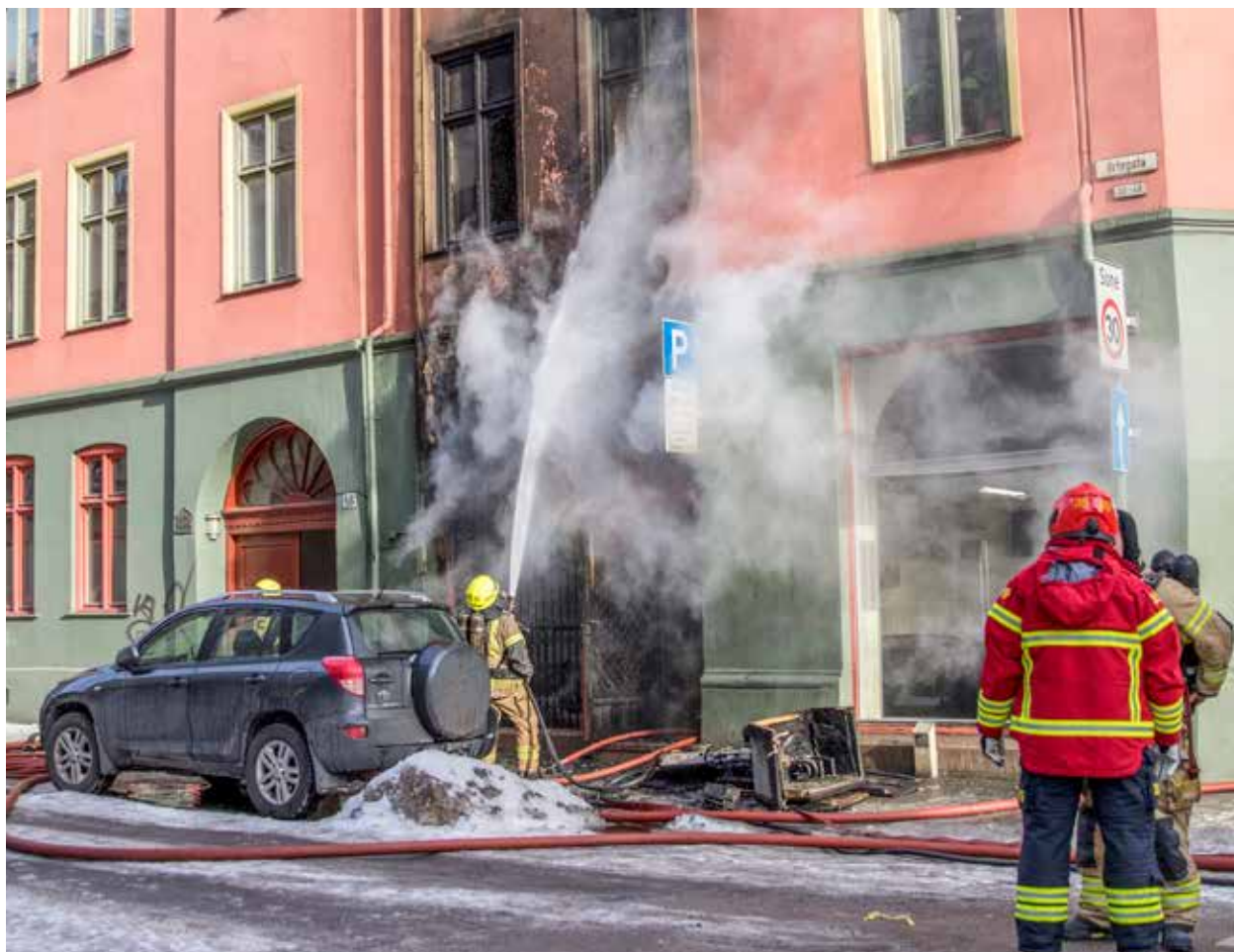
Brannetterforskning er krevende.

DSB oppfordrer det lokale el-tilsyn og brann- og redningsvesen til å bidra i brannetterforskningsgruppene med faste deltakere i hvert politidistrikt. Gruppene ledes av politiet. I følge DSB har 8 av 12 politidistrikter helt eller delvis etablert brannetterforskningsgrupper.