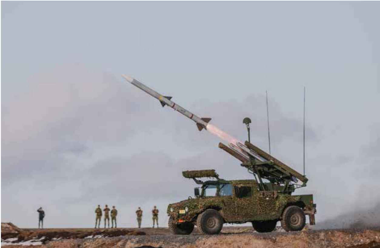
Ressursene må jevnlig oppjusteres.