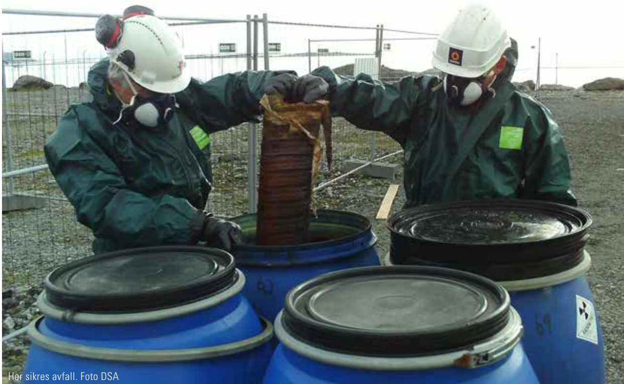
Her sikres avfall.

Siden 2020 er det vedtatt at staten skal ta det fulle og hele ansvaret for oppryddingen etter atomvirksomheter i Norge. Nå vanker det internasjonal anerkjennelse for arbeidet.