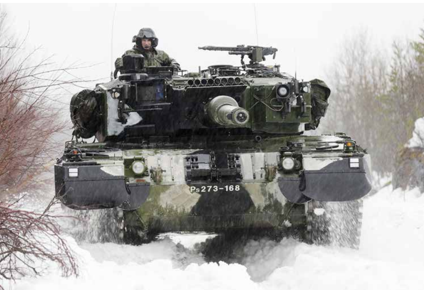
Landmakt krever fornyelse av materiell.

Dette er brennbare spørsmål, som ikke blir mindre brennbare når kommisjonslederen spør om det er slik at forsvarssjefen bare opptrer som en megler mellom noen våpengrener og noen aktører, som gjør at man må finne minste felles multiplum for å få ro i familien!