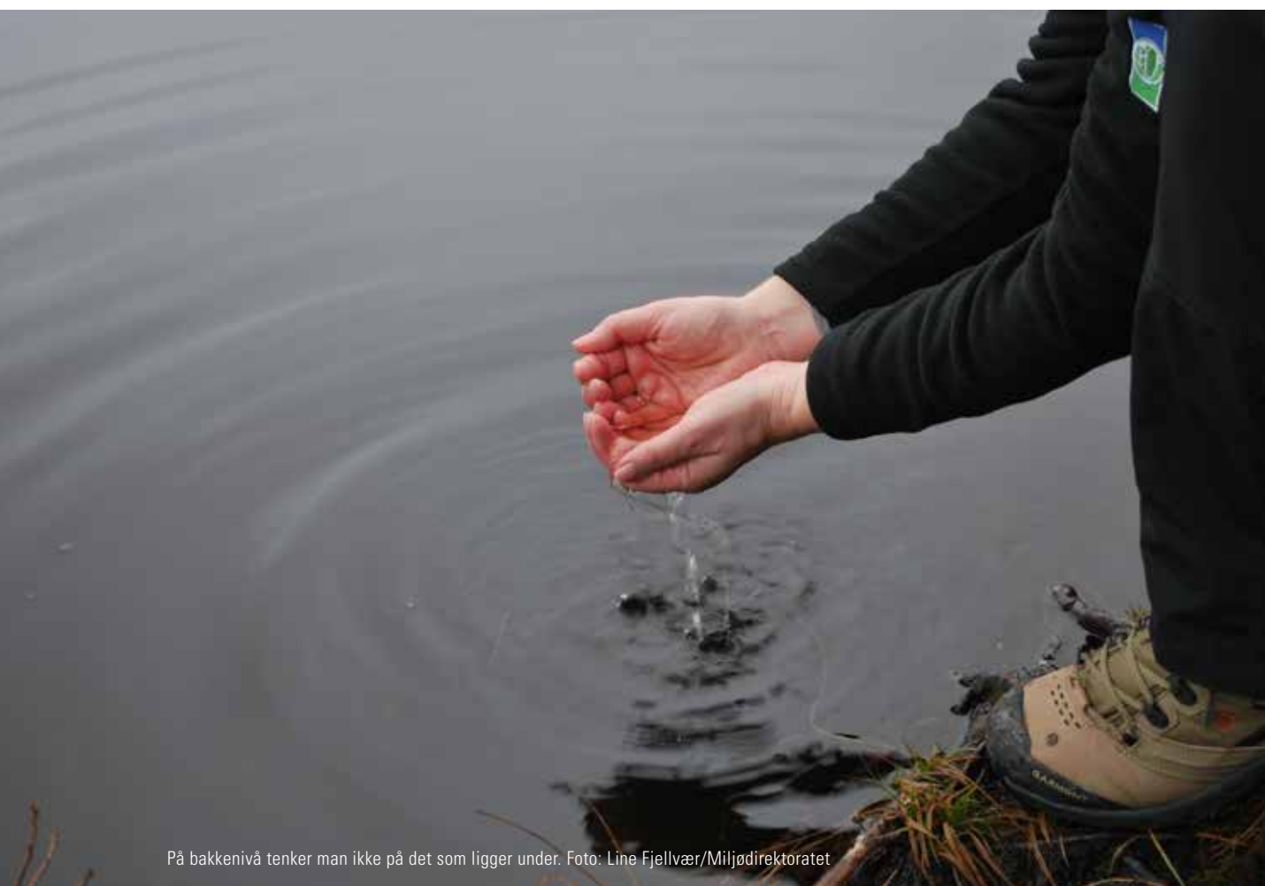
På bakkenivå tenker man ikke på det som ligger under.

Det er Staten som bærer utgiftene når større hendelser inntreffer. Men, naturlig nok, er søkelyset alltid rettet mot de steder på kartet som rammes. Uansett har vi i Norge et velorganisert hjelpeapparat som er klart til innsats. Brann- og redningsvesenet, Sivilforsvaret, Heimevernet og frivillige organisasjoner sover alle med skoene på.