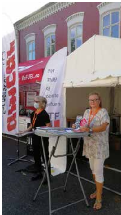
NTFs stand.

I tillegg til sine egne arrangementer var NTF medarrangør i to større seminarer sammen med tolv andre frivillige organisasjoner. I debatten «Hva vil politikerne med Forsvaret?» var alle de største partiene representert i et panel. En fullsatt sal fikk anledning til å stille spørsmål, og det ble en interessant diskusjon der de ulike partiers