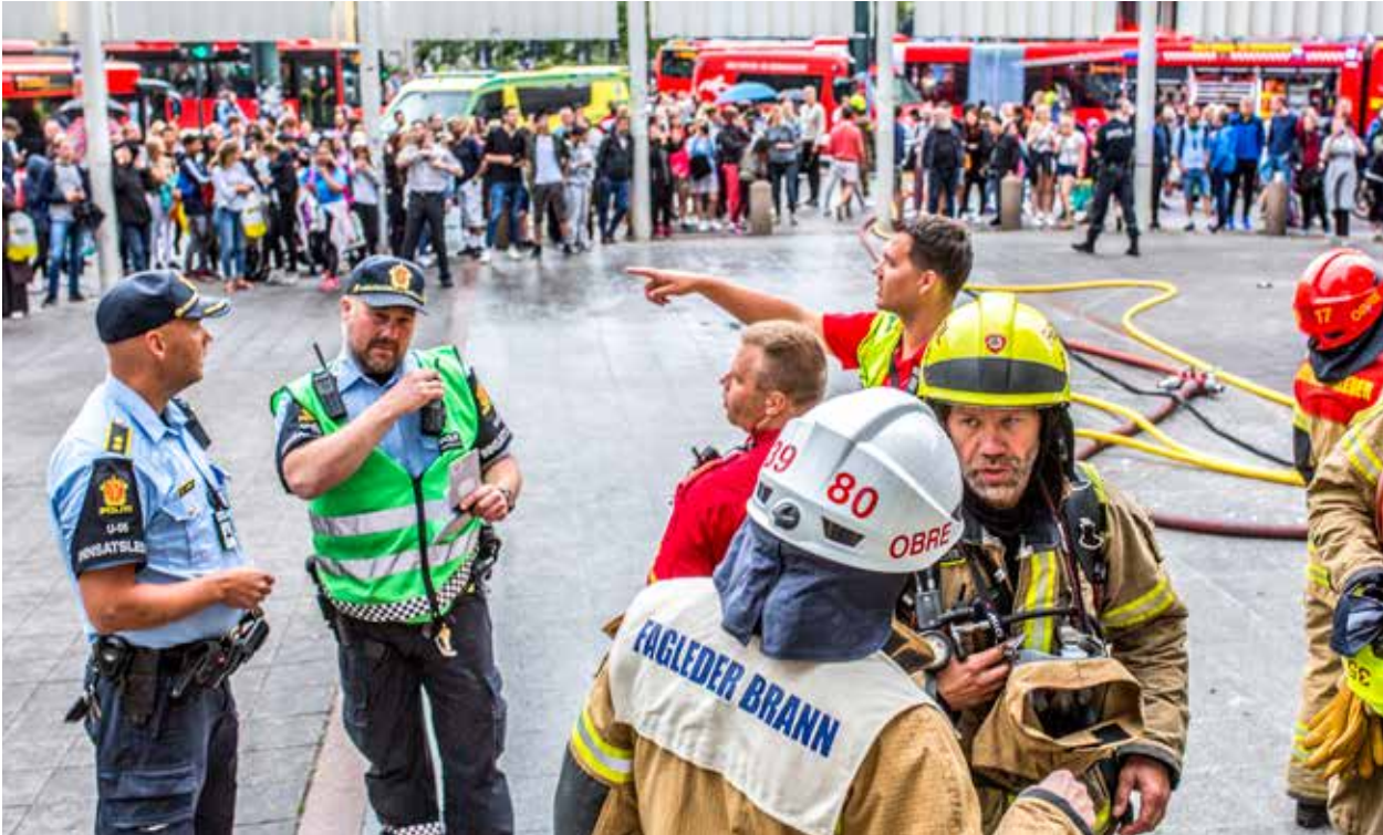
Fra "Øvelse Samvirke". Viktig å øve jevnlig sammen.