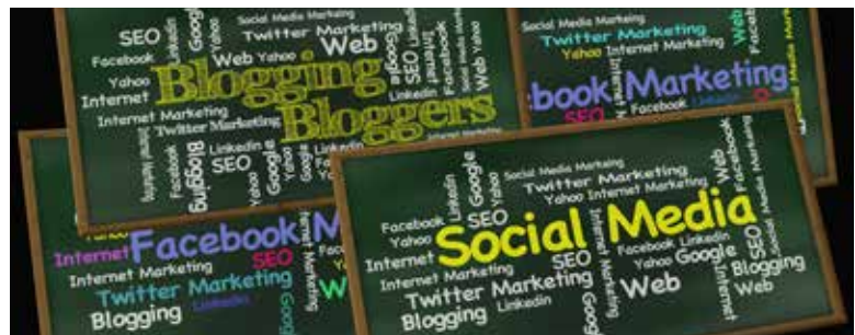
Det er mange fallgruber i sosiale media.

Etter som tiden går har feilinformasjon blitt et stadig større problem. Faren med Fake News er at den kan brukes til å oppnå politiske mål. Langsiktig og strategisk planting av falske nyheter i media gjør at folk etter hvert ikke vet hva de skal tro på. Det dreier seg om en stor trussel mot et fritt mediemangfold og demokratiske prinsipper. Falske nyheter kan føre til at folk tar feil valg og kan få en feil oppfatning av virkeligheten.