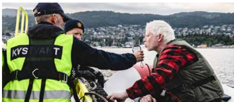
Fra en promillekontroll i Molde.

- Vi slår sammen våre kompetanser. Kystvakta har både utstyr og spisskompetanse når det gjelder å operere på sjøen. Når de blir backet opp med politiet og operasjonssentralen blir resultatet en effektiv og ressurssterk kombinasjon som kan være avgjørende hvis noen trenger hjelp i eller ved sjøen. Når en stor festival blir arrangert på bryggekanalen er det ikke