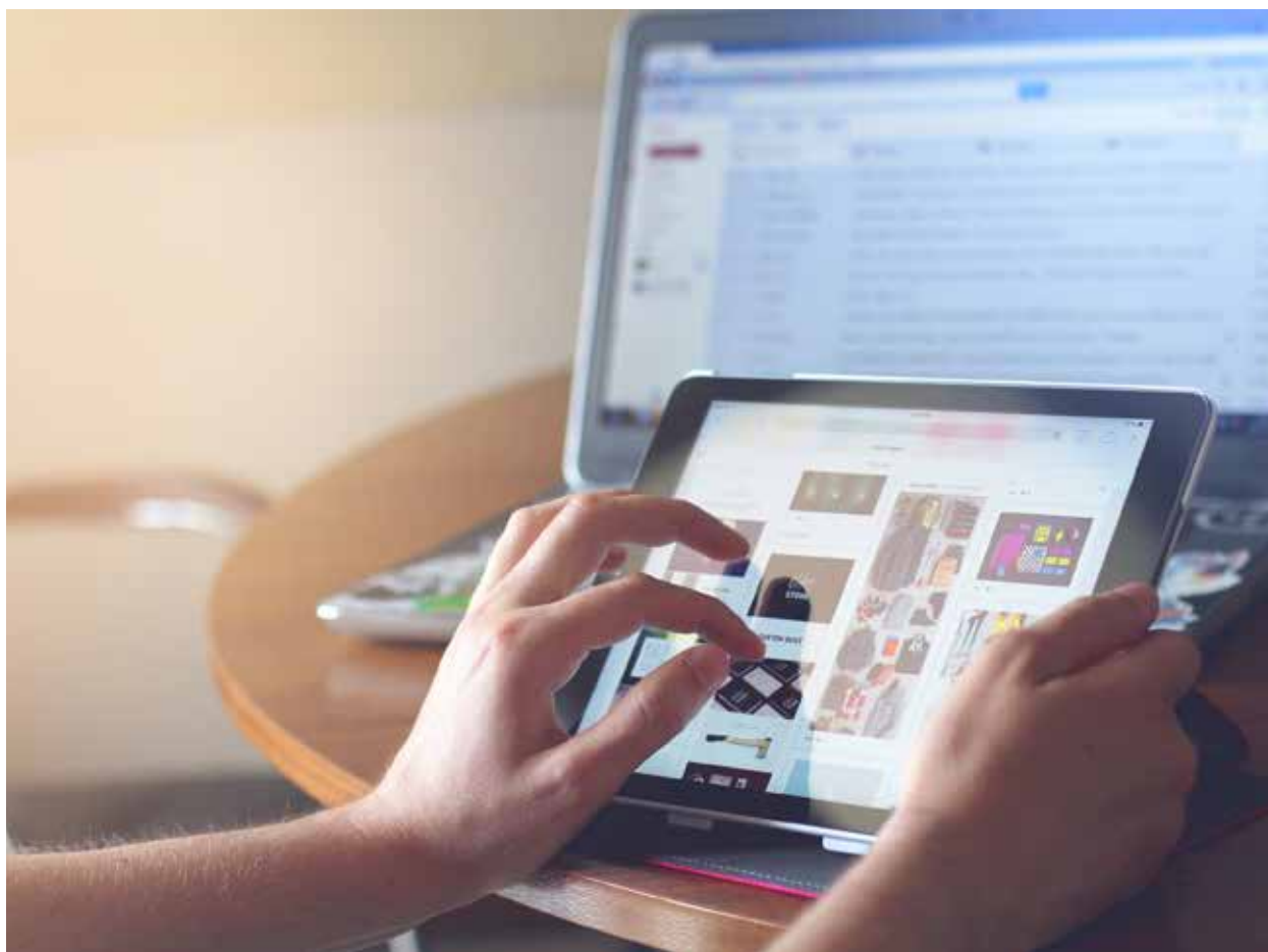
Nordmenn er flittige nettbrukere.