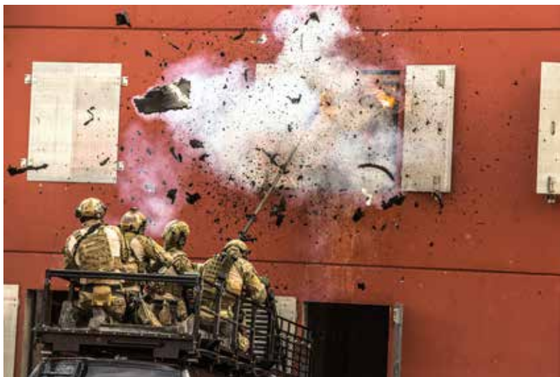
Beredskapstropper under øvelse.

Resiliens, psykologisk motstandskraft, er et begrep som stadig får økende oppmerksomhet i beredskapssammenheng. På årets «Verdikonferanse» fortalte representanter fra samtlige beredskapsetater hvorfor dette er så viktig.