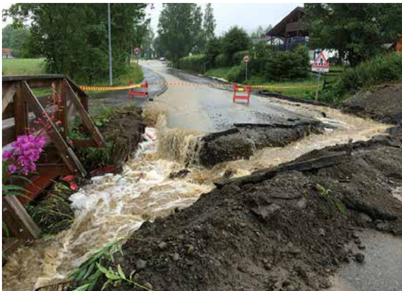
Så galt kan det gå.

I følge analysen vil det koste rundt 85 milliarder kroner dersom bygg som er utsatt for skred i bratt terreng, flom, erosjon og kvikkleireskred skal sikres. Av dette utgjør ca. 45 prosent kostnader for sikring mot flom og