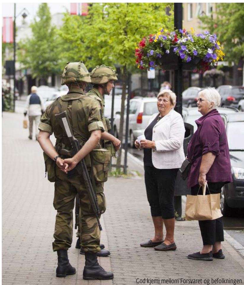
God kjemi mellom Forsvaret og befolkningen.

54 prosent mener at Forsvaret gjør en god jobb med å forsvare Norge med hjelp av NATO, mens 11 prosent mener det motsatte. 66 prosent svarer at de har et godt inntrykk av NATO, 9 prosent har et dårlig inntrykk. Nærmere åtte av ti mener Norges medlemskap i NATO er viktig. Sju av ti svarer at de er enige i at innkjøp av kampfly er viktig for Norges forsvarsevne.