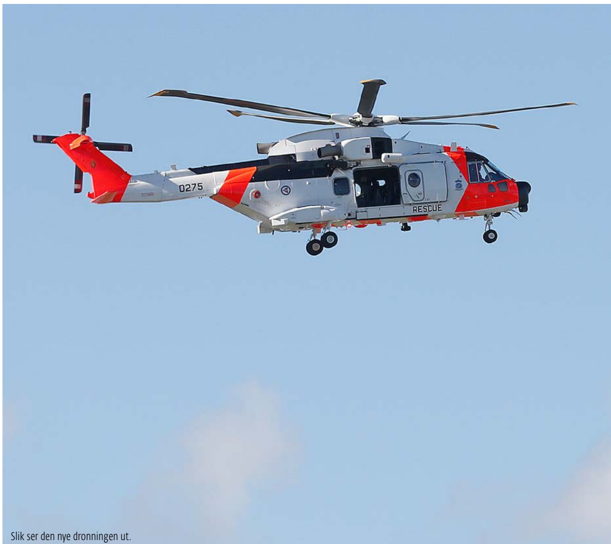
Slik ser den nye dronningen ut.