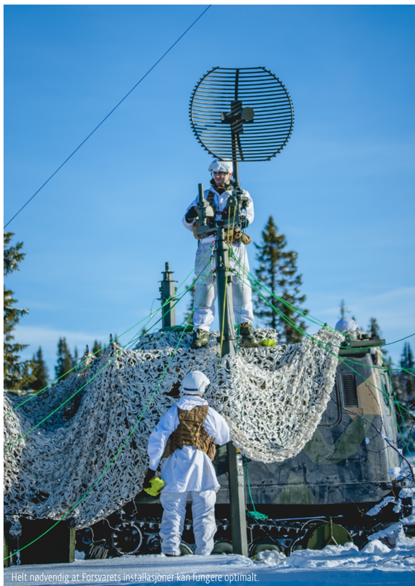
Helt nødvendig at Forsvarets installasjoner kan fungere optimalt.

Regjeringen ser det som en utfordring at den informasjonen som E-tjenesten har tilgang til allerede i dag i stor grad har knyttet seg til andre kommunikasjonskanaler, nærmere bestemt fiberkanaler, der tjenesten ikke har tilgang.