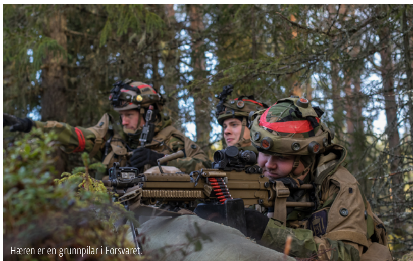
Hæren er en grunnpilar i Forsvaret.