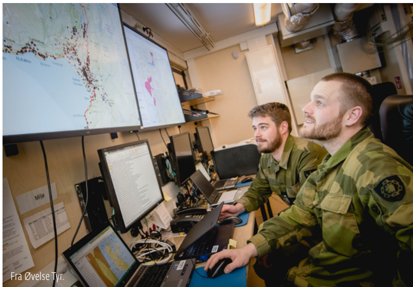
Fra Øvelse Tvr.

Den andre avdelingen, CYFORCTO, er en militær organisasjon for fremtiden. De fremste oppgavene er tjenesteleveranser, drift og forsvar av Forsvarets IKT-systemer foruten å levere sensor- og radardata til operative miljøer. Avdelingen er dessuten ansvarlig for teknisk drift og videreutvikling av Forsvarets integrerte forvaltningssystem. Bidraget til samfunnssikkerhet ligger i overvåking og informasjonsinnhenting,