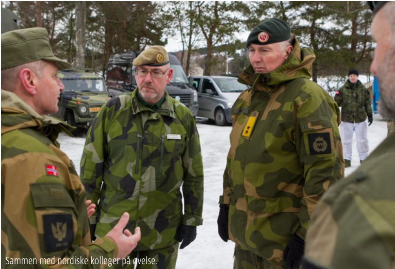
Sammen med nordiske kolleger på øvelse.