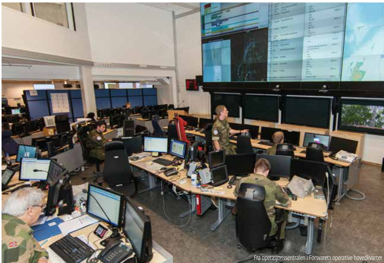
Fra operasjonssentralen i Forsvarets operative hovedkvarter.