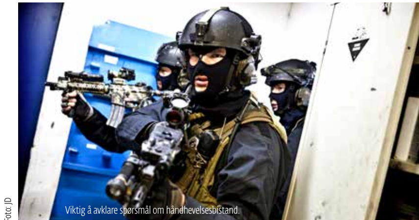
Viktig å avklare spørsmål om håndhevelsesbistand.