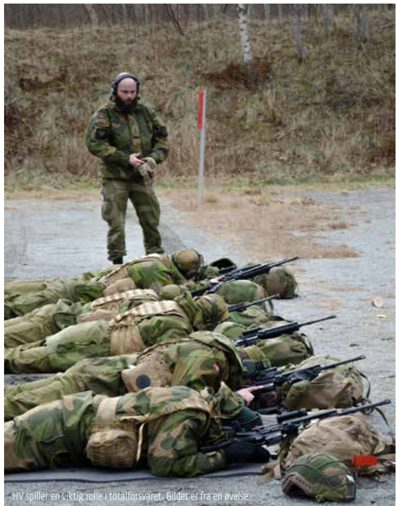
HV spiller en viktig rolle i totalforsvaret. Bildet er fra en øvelse.

NATO understreker at sivil beredskap, krisehåndtering og robuste samfunnskritiske funksjoner er en forutsetning for det enkelte lands, og dermed alliansens, samlede beredskap og forsvar. NATO har vedtatt en rekke grunnleggende forventninger til medlemsstatene. I alle kriser skal landene sørge for å kunne opprettholde en fungerende nasjonal kriseledelse, håndtere mange skadde og forflytning av mennesker, sikre mat-, vann- og energiforsyning og sikre kommunikasjons- og transportsystemer. Oppfølgingen av dette er tatt inn som prosjekter i det nye programmet for utvikling av totalforsvaret.