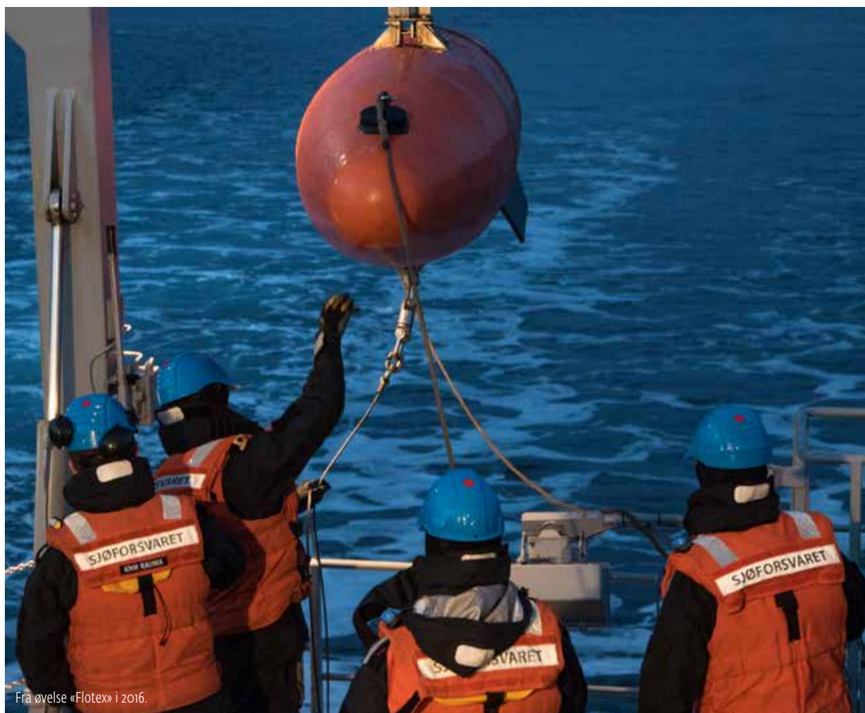
Fra øvelse «Flotex» i 2016.