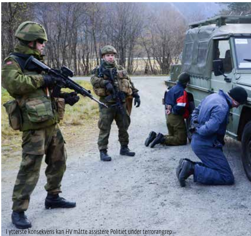
I ytterste konsekvens kan HV måtte assistere Politiet under terrorangrep.

Det er lett å bli nostalgisk, men verden er blitt en annen. Også HV må avfinne seg med forandringer, men uansett hva landmaktutredningen kommer til å konkludere med vil nærhet og lokalkunnskap forbli viktige faktorer.