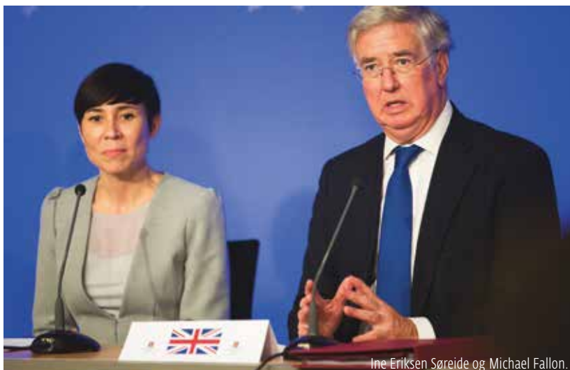
Ine Eriksen Søreide og Michael Fallon.