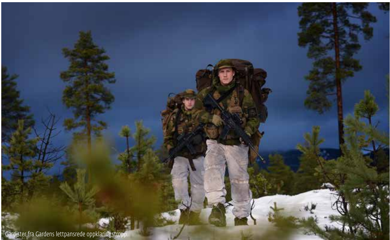
Gardister fra Gardens lett pansrede opplæringsropp.