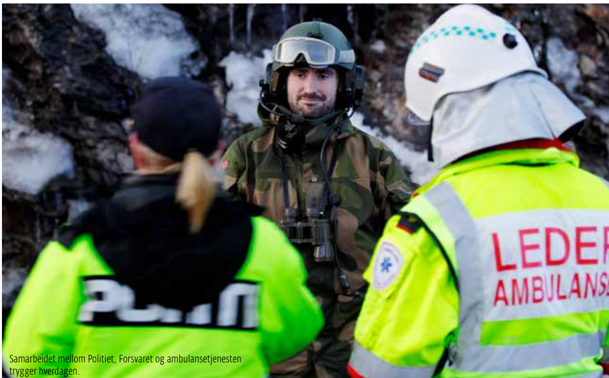
Samarbeidet mellom Politiet, Forsvaret og ambulansetjenesten trykker hverdagen.

Den nye Stortingsmelding 10 «Risiko i et trygt samfunn» (2016–2017) om samfunnsikkerhet, er et viktig bidrag i regjeringens arbeid med å gjøre Norge enda tryggere.