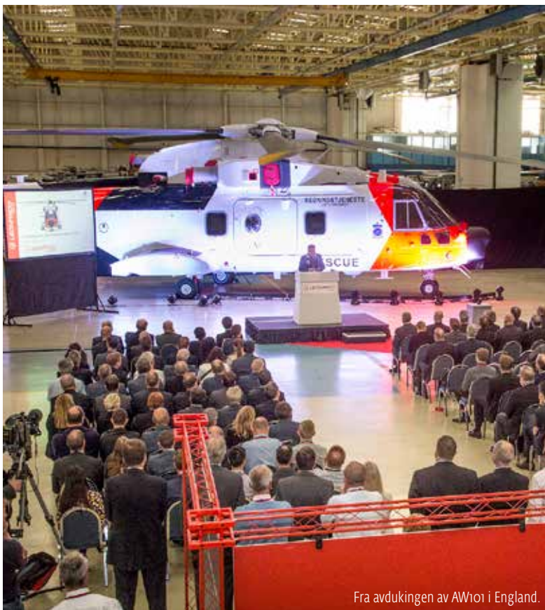
Fra avdukingen av AW101 i England.

I første omgang vil det komme to helikoptre. 330 skvadron skal være fullt operativ med nye helikoptre innen 2020.