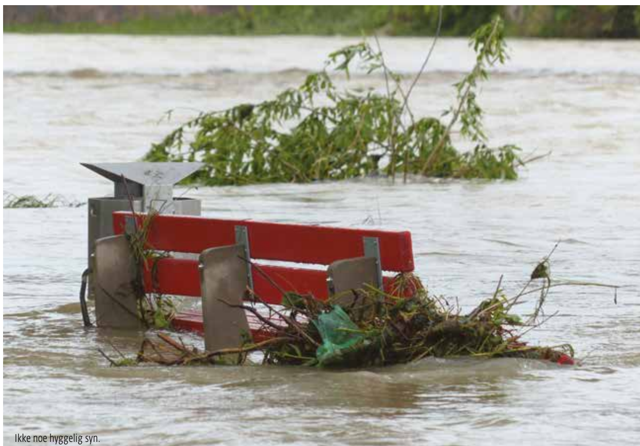
Ikke noe hyggelig syn.

– I utgangspunktet evner kommunene å håndtere de fleste hendelser på en rimelig god måte. Men når de virkelig store krisene inntreffer er det avgjørende at kommunene har gjort gode risiko- og sårbarhetsanalyser og at de har en gjennomarbeidet og øvet beredskapsplan. Loven stiller jo krav til dette, men vi ser dessverre at enkelte kommuner fremdeles ikke tar dette på tilstrekkelig alvor. Kommuneundersøkelsen er gjennomført år-