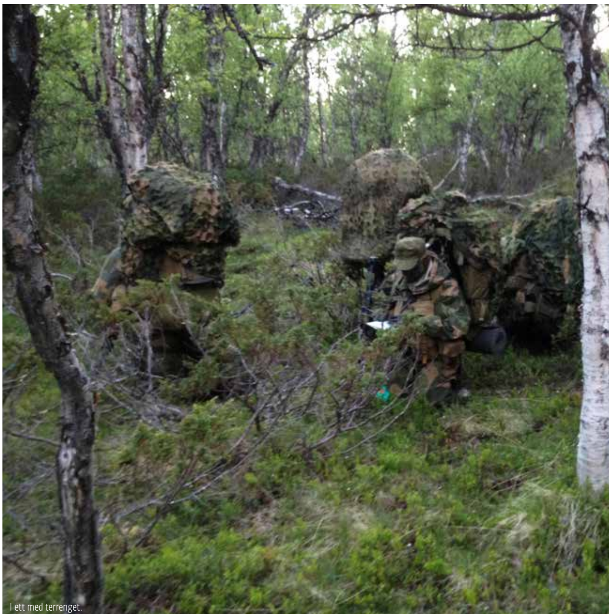
I ett med terrenget.