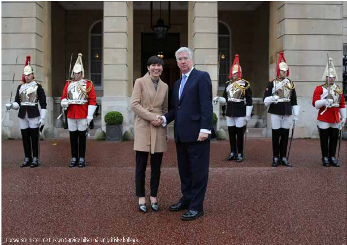
Forsvarsminister Ine Eriksen Søreide hilser på sin britiske kollega.