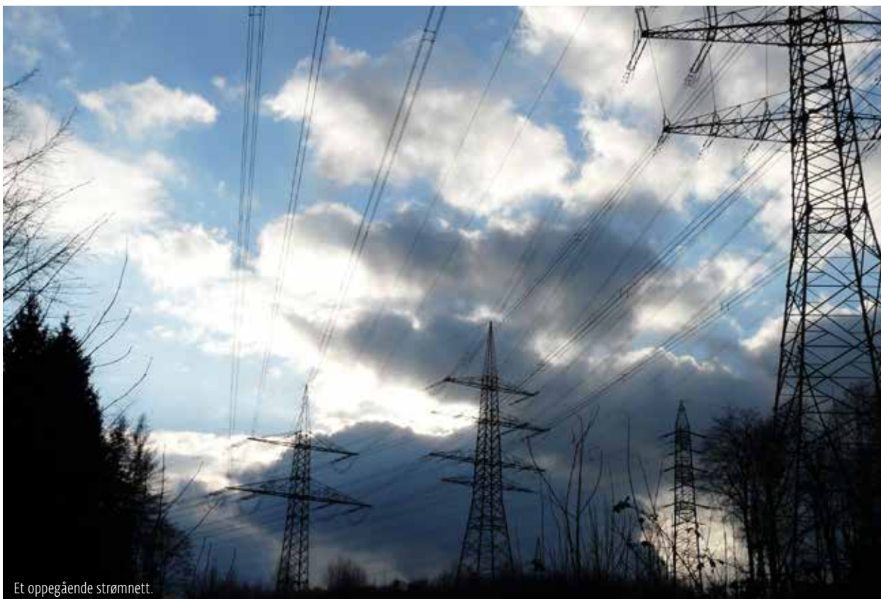
Et oppegående strømnnett.