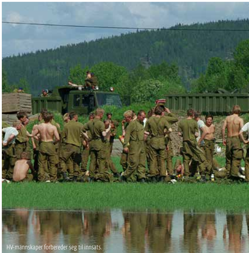
HV-mannskaper forbereder seg til innsats.

I forbindelse med «Synne» var det store utfordringer grunnet så mange stengte veier. En så seg faktisk nødt til å rekvirere en losbåt for å hente ut-hvilte mannskaper via Hellvik nord for Egersund. I Egersund støttet distrikts-sjefen i Sivilforsvaret Kommunal kriseledelse. Sivilforsvarets mannskaper bisto med evakuering sikring, vakthold, sandsekker og lensing.