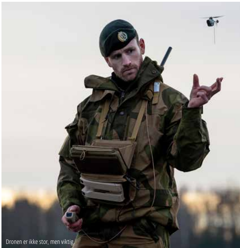
Dronen er ikke stor, men viktig.

Det er Luftforsvarets flytaktiske skole (LFTS) på Rygge som er ansvarlig for utdanningen av flygere til alle typer flymaskiner, både bemannede fly og ubemannede farkoster som Black Hornet. Det er nå utdannet en rekke instruktører på systemet. Målet er at de ulike avdelinger skal kunne ta i bruk dronen i løpet av vinteren.