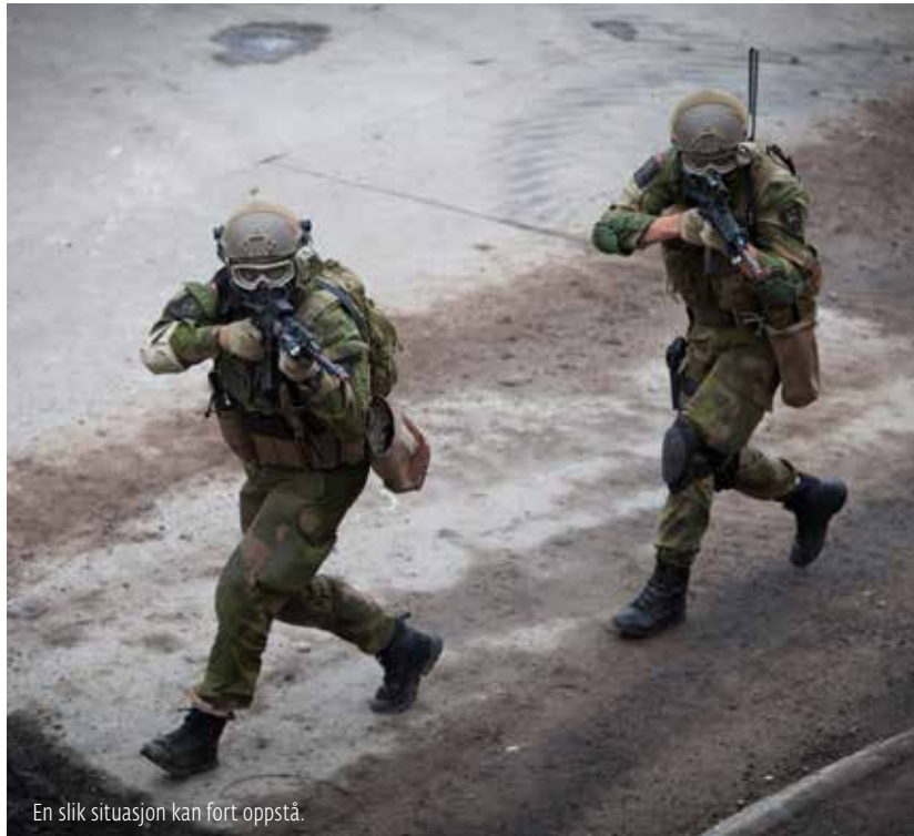
En slik situasjon kan fort oppstå.

Han legger til at Norge fra før har sterke forskningsmiljøer på Jihadis-