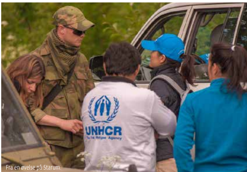
Fra en øvelse på Starum