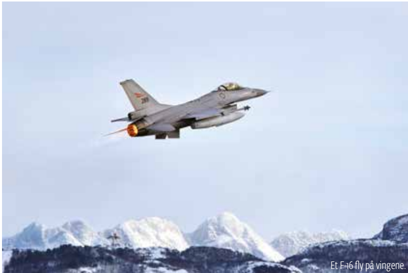
Et F-16 fly på vingene.

Ingen fly kommer inn over norsk luftrom uten at operasjonssentralene til Forsvaret vet om det.