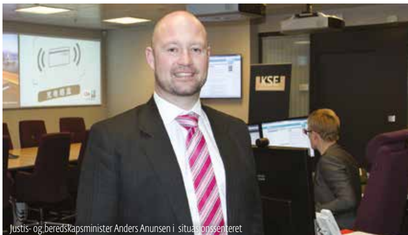
Justis- og beredskapsminister Anders Anunsen i situasjonscenteret