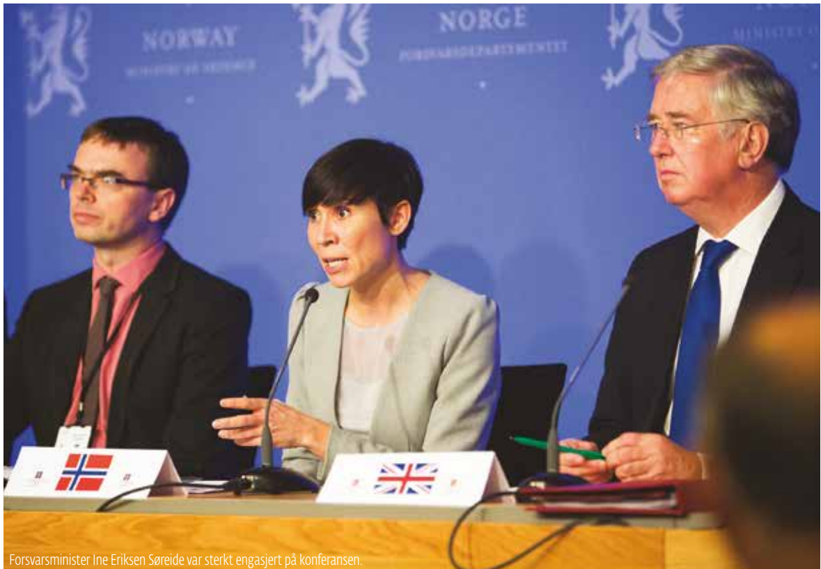
Forsvarsminister Ine Eriksen Søreide var sterkt engasjert på konferansen.