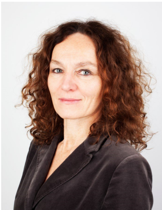
Camilla Stoltenberg

- Forskning og innovasjon er god beredskap