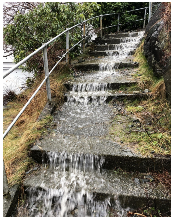
Overvann i Bergen

- Forskning og innovasjon er god beredskap