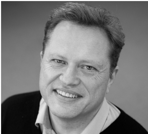
Per Strand / Foto: DSA

Formålet med veilederen er å bidra til at beredskapsanalysene innfrir de forventninger og krav som brann- og redningsvesenets forskrift setter til slike analyser. Veilederen fastsetter hvilket nivå brann- og redningsvesenet skal ha for sin beredskap for å kunne håndtere hendelser. Deretter settes det krav til håndtering av dimensjonerende hendelser. Videre skal veilederen identifisere hvilke ressurser (utstyr, personell, kompetanse o.l.) som er nødvendig for å håndtere de fastlagte uønskede hendelsene innenfor definerte krav (dimensjonerende krav). Dette gjelder spesielt interne ressurser, men også eventuelle behov for eksterne ressurser og samarbeid med andre. Veilederen ligger ute på dsb.no