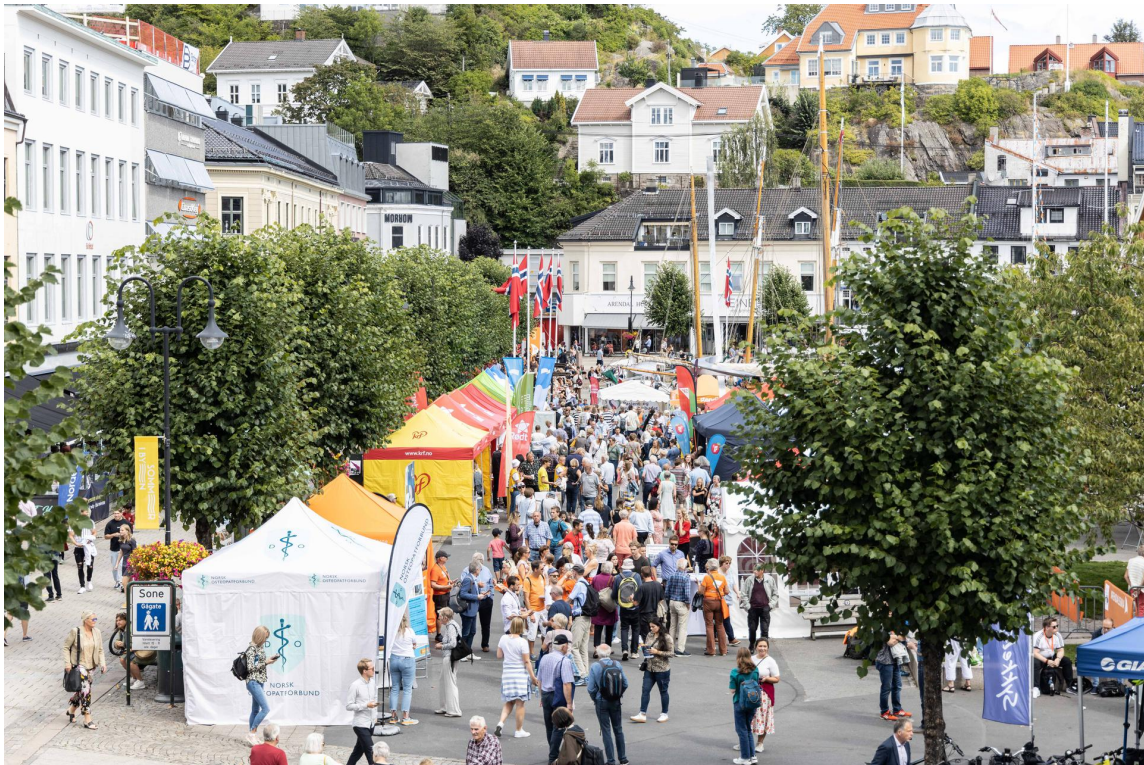
Arendalsuka 2021

INFORMASJON OM TOTALFORSVARET NR. 3 2022