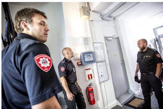
på inspeksjon i en bygård i Oslo

– Dette er en svært viktig, men komplisert operasjon som sikrer at de ukrainske pasientene får behandlingen de trenger. Norge har unik transportmedisinsk kompetanse som nå kommer Ukraina til nytte. Ambulanseflyet bemannes av Forsvaret med leger, sykepleiere og ambulanspersonell ombord. Det er helsepersonell som normalt jobber i den norske helsetjenesten, men som har en avtale om å være i beredskap for Forsvaret, sier forsvarsminister Bjørn Arild Gram.