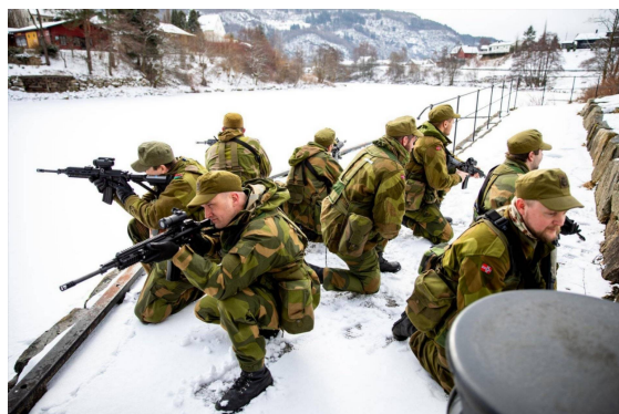
Sira Kvina HV-område under øvelse Jøssing