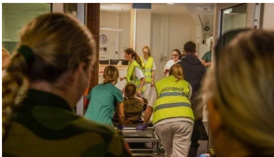
Foto: Sivilmilitær helseøvelse