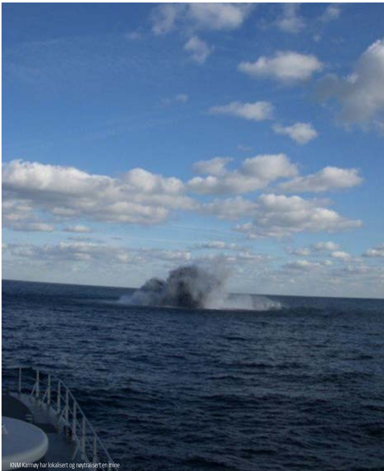
KNM Karmøy har lokalisert og nøytralisert en mine.