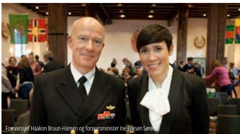
Forsvarssjef Haakon Bruun-Hansen og forsvarsminister Ine Eriksen Søreide.

Dialogkonferansen samlet om lag 150 deltakere fra hele forsvarsektoren.