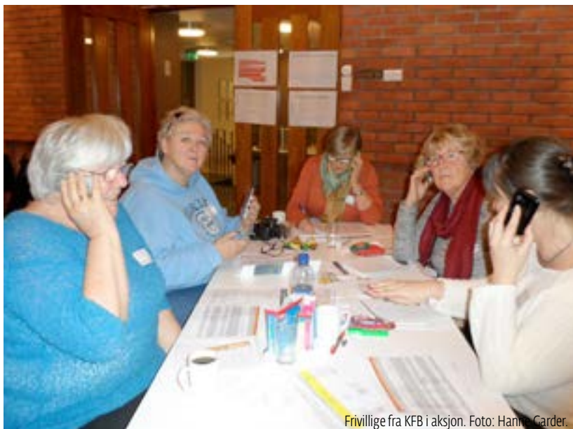
Frivillige fra KFB i aksjon.

Årets krisespill er «Kapring og terroraksjoner på cruiseskip i Oslo». Konferansen fant sted 25. februar. Utførlig omtale kommer i neste utgave av Trygge Samfunn.