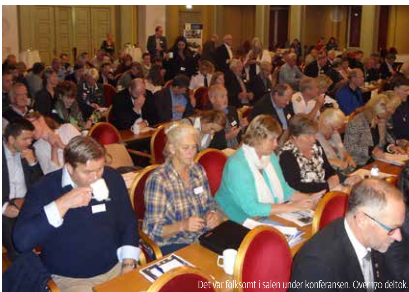
Det var folksomt i salen under konferansen. Over 170 deltok.

– Tidlig intervensjon kan avverge alvorlige hendelser. Det finnes grunn-