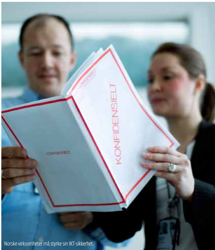
Norske virksomheter må styrke sin IKT-sikkerhet.

– NSM må stadig forholde seg til nye utfordringer og muligheter. Vi ser også nødvendigheten av å gjennomføre kompetanseheving av vårt eget personell. Vi ser for oss at etterspørselen etter rådgivning vil