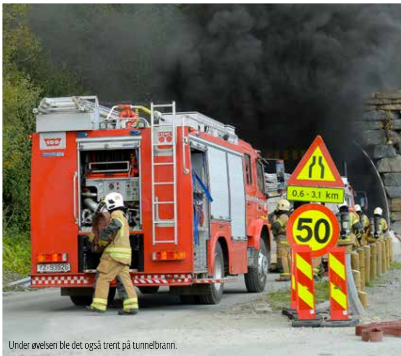
Under øvelsen ble det også trent på tunnelbrann.

Hva skjer når et massivt fjellskred med påfølgende tsunami utløses i Lyngen i Troms? Dette var scenarioet for øvelse Barents Rescue.