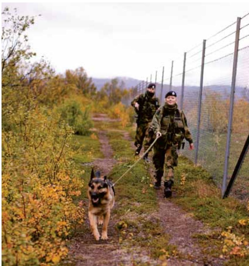
Firbeint patruljering.